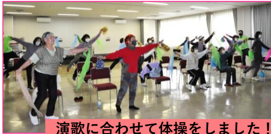
演歌に合わせて体操をしました！

通信カラオケ機器「DAM」を活用した、介護予防・健康増進コンテンツ配信システムです。音楽・体操・映像等のオリジナルのプログラムを通じて、健康づくり体験ができます。