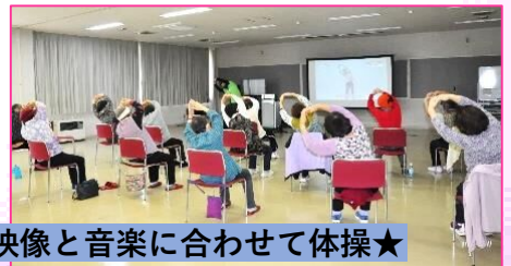
映像と音楽に合わせて体操★