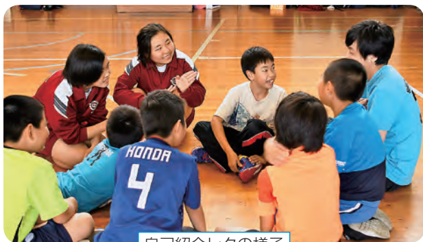
自己紹介レクの様子

わらべうたのリズムに合わせたレクなどを利用者の皆さんと一緒に楽しみました。利用者の方の目線になって進行することを心がけました。