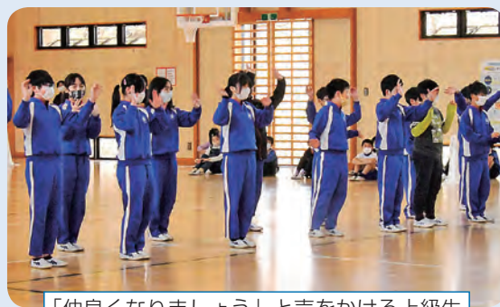
「仲良くなりましょう」と声をかける上級生