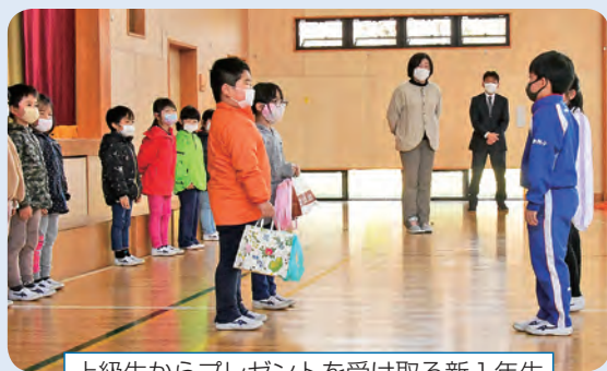
上級生からプレゼントを受け取る新1年生

上級生たちは、新1年生に向けて「困ったことがあれば、いつでも助けます。早く仲良くなりましょうね。」と声をかけました。