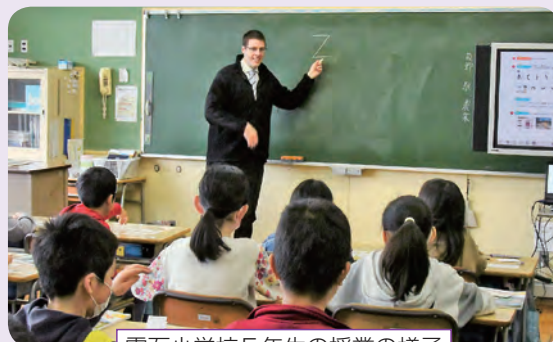
栗石小学校5年生の授業の様子