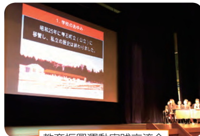
教育振興運動実践交流会