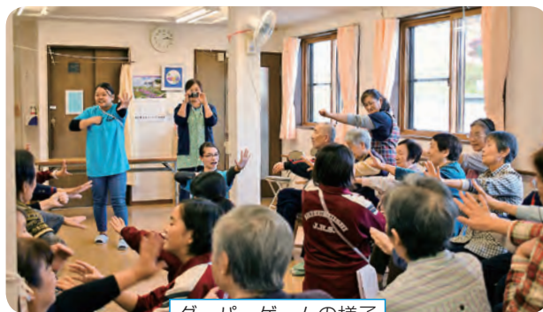
グーパーゲームの様子