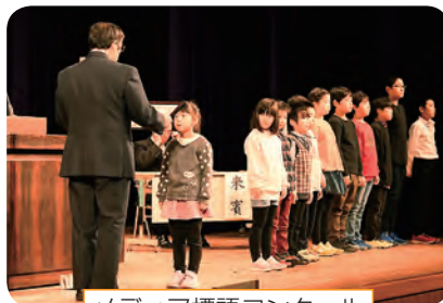
メディア標語コンクール