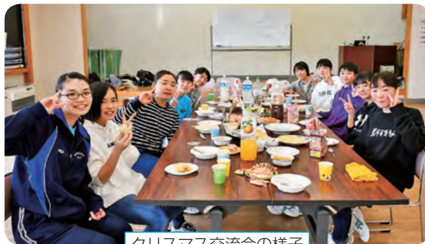
クリスマス交流会の様子