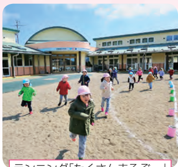
ランニング「たくさん走るぞ〜」

体を動かすことが大好きな子ども達が、この幼児期に経験すべき運動をとおして、意欲・気力・対人関係の構築など、健康な心と体を育てていくような関わりをこれからも大切にしていきたいと思っています。