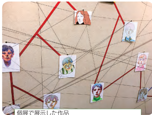
個展で展示した作品「RELATIONSHIPS (リレーションシップ)」

(伊) 個展では、空間全体を使っていろいろな関係性を表現しました。今まで描いてきたいろいろな時の自分の絵を持ち寄ってひとつの作品にしたので、これまでの18年間で詰まった個展になりました。開催期間中は全て在廊していたので、来場した方の反応をその場で感じられたことはとても大きかったです。自分の意図していたテーマが作品を通して伝わると、とても達成感がありました。