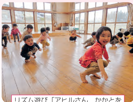
リズム遊び「アヒルさん かかとを上げて1・2・1・2」