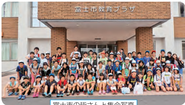
富士市の皆さんと集合写真

町内在住の中高生と SKY の交流の場としてクリスマス交流会を企画しました。中学生7人が参加し、レクゲームで楽しんだり、クレープを作って食べたり、交流を深めました。