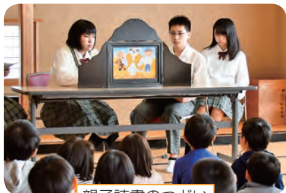
親子読書のつどい