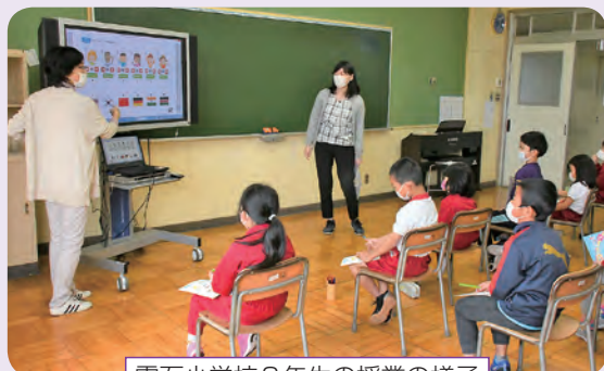
栗石小学校3年生の授業の様子

町では、ALT（外国語指導講師）1人と外国語活動支援員3人を配置して各学校の外国語授業を支援し、外国語教育の充実を図っています。