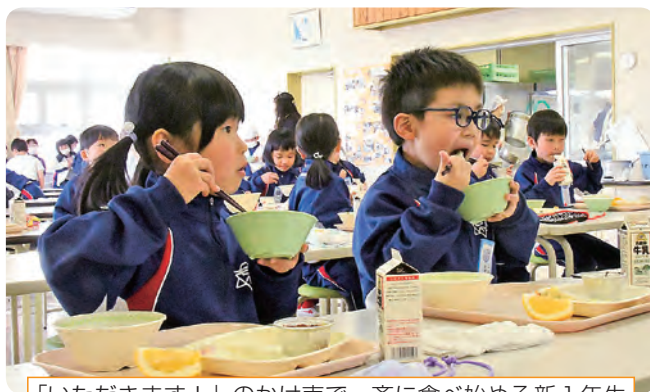
「いただきます！」のかけ声で一斉に食べ始める新1年生