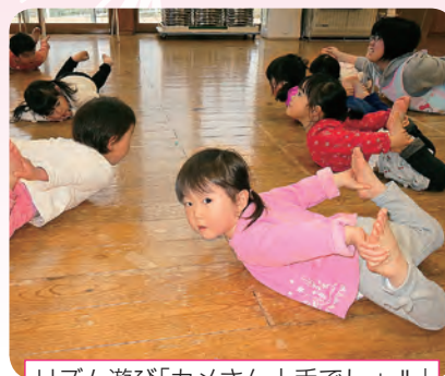
リズム遊び「カメさん上手でしょ!!」