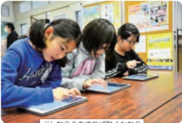
どんな命令をすれば動くかな？

児童はどのように命令すればタブレット上のイラストが思い通りに動くか考えながら、プログラミングの基礎を学びました。