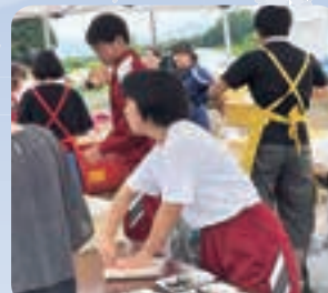
デイサービスセンター夏祭り

そのような準備を経て、町ボランティアフェスティバルへの参加、老人ホームへの訪問、デイサービスセンター夏祭りの運営ボランティアなど多岐にわたる活動を行いました。他にも3年生が行う国道清掃や早朝から親子で行う草取り作業などで汗を流しています。