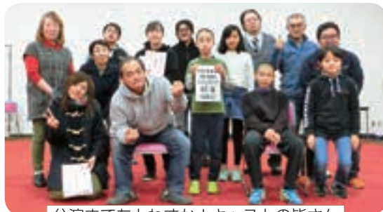
公演まであとわずか!キャストの皆さん

(土) 演劇は、生だからこそ伝えられることがたくさんあります。せっかくテーマは私たちや皆さんが良く知っている雫石町ということで、ぜひ見に来ていただきたいです!