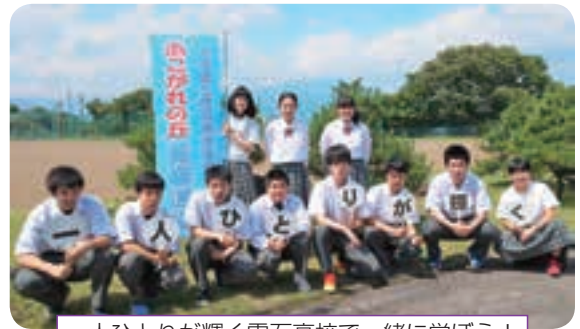
一人ひとりが輝く雫石高校で一緒に学ぼう！

町の皆さんのおかげで「雫石高校将来ビジョン」が平成30年に策定され「新生雫石高校」として生まれ変わりました。地域の皆さん、保護者の皆さんのご協力のもと、一人ひとりの夢をかなえる充実した高校生活が送れます。地域の宝、地域を支える人材を輩出する雫石高校で皆さんを待っています。気軽に見学や進路相談に来てください。