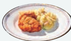
チキンプレストとポテトサラダ