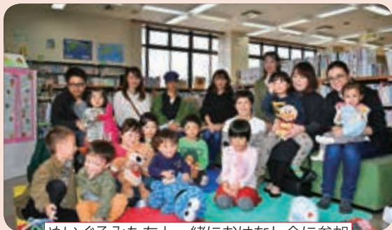
ぬいぐるみたちと一緒におはなし会に参加

令和元年10月26日(土)から27日(日)に、幼児を対象として、「ぬいぐるみのおとまり会」を開催しました。自分のぬいぐるみと一緒におはなし会に参加し、ぬいぐるみたちは図書館にお泊りしました。お泊り会の様子は、写真に撮ってアルバムにし、翌日子どもたちにプレゼント。最後に、ぬいぐるみたちが一晩かけて子どもたちのために選んでくれた絵本を借りました。