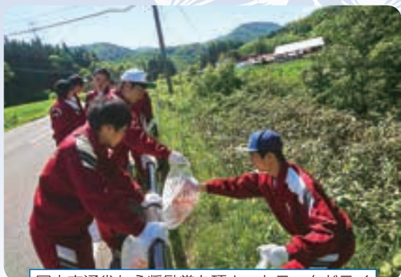
国土交通省から奨励賞を頂き、トラックドライバーの方から感謝の電話が寄せられた国道清掃

今年度、生徒会は、「SJHボランティアプロジェクト」をスタートさせました。雫石町福祉協議会の方のご指導を受け、ボランティアの意義についてグループ討議や発表会を行ったり、みんなを惹きつけるポスター作りに取り組んだりしました。