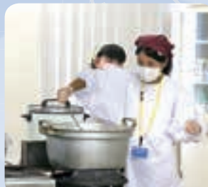
町ボランティアフェスティバル