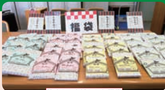
皆さんにお渡しした福袋

令和2年1月4日(土)から8日(水)に、本のタイトルなどを隠し、一言ヒントで選んでもらう福袋形式の貸出を行いました。本図書館では初の試みで、来館者にも大盛況。いつもは自分では選ばないような本に巡りあえた方も多かったようです。