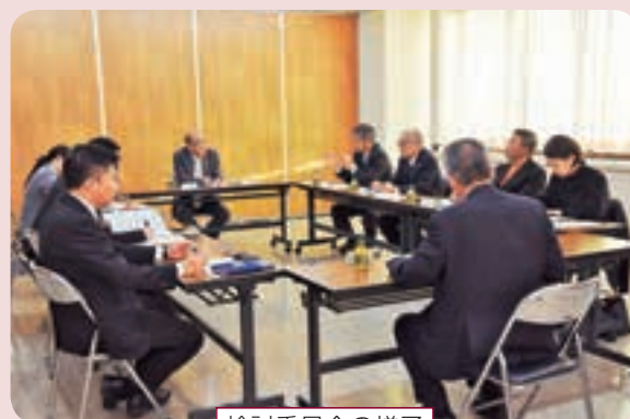
検討委員会の様子

今回は、国や県の動向と、委員会を開催した経緯の理解を図るとともに、平成31年2月に策定した「雫石町における部活動の方針」に基づき、参加した関係者が実態を述べながら、取り組みを推進するための意見交換を行いました。