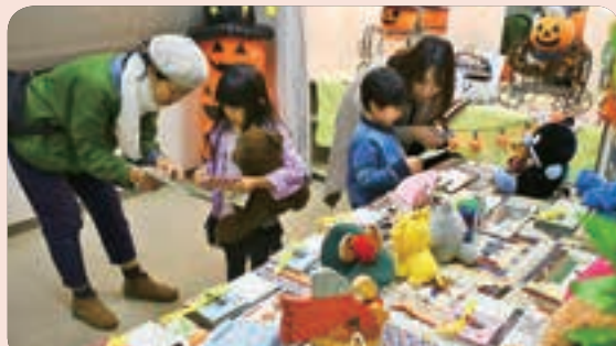
ぬいぐるみたちに選んでもらった絵本を眺める子どもたち