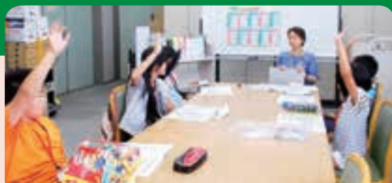
司書からの質問に対して積極的に発言する子どもたち

令和元年7月7日(日)に、小学生を対象に、夏休みに向けて自由研究の講座を行いました。テーマの決め方、百科事典の引き方、本の調べ方、まとめ方などを図書館司書から教えてもらい、実際に本を探しながら熱心に勉強しました。