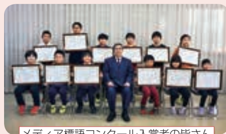
メディア標語コンクール入賞者の皆さん

ノーゲームデーを意識することで自分の生活をふり返り、生活リズムをつ くっていくきっかけにしましょう。