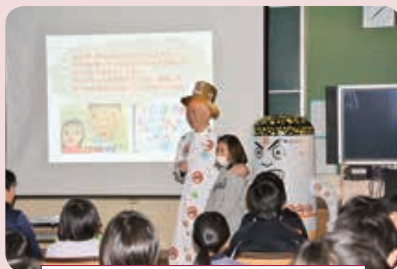
タバコをやめるよう説得する練習もしました

禁煙マークが貼られた帽子と白衣を着た先生は、タバコが有害である理由や関連する病気について説明し、児童は有害物質のひとつであるタールを実際に目にするなど、タバコの知識を深めました。