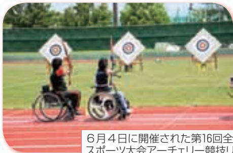
6月4日に開催された第16回全国障害者スポーツ大会アーチェリー競技リハーサル大会

予選ラウンドでは1選手が70m先の的に4分以内に6回矢を放ち、これを12回繰り返して、3人の合計得点が多いチームが決勝ラウンドに進むんだ。個人戦は予選ラウンドの個人ごとの結果で決まるんだよ。