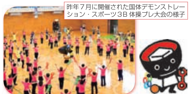
昨年7月に開催された国体デモンストレーション・スポーツ3B体操プレ大会の様子

国体では、県内各地から900人近い会員が出場して、いくつかのグループに分かれ、それぞれおそろいの華やかな衣装を身にまとい、演技を発表するよ。