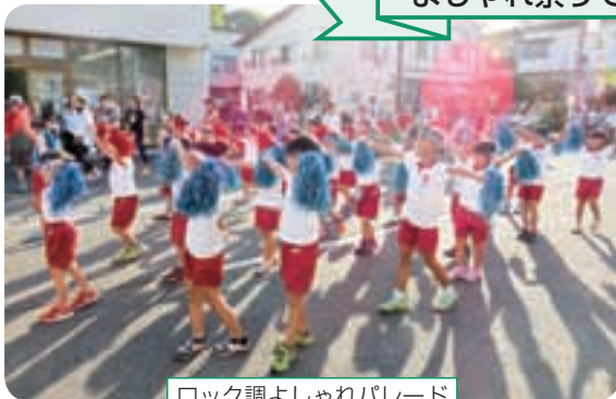
ロック調よしゃれパレード