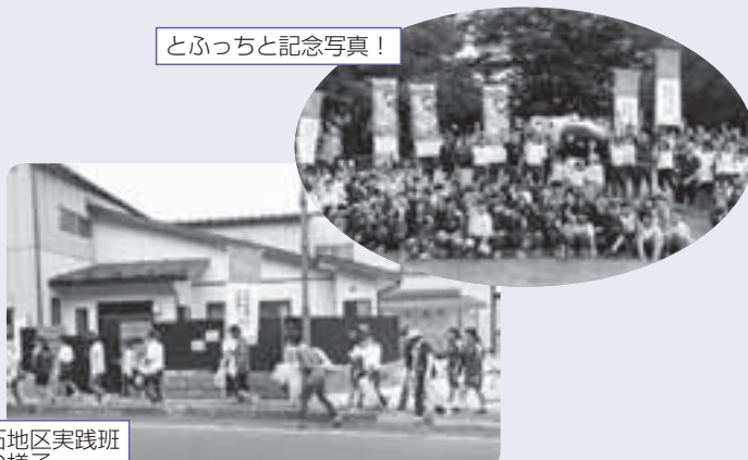
栗石中学校実践区栗石地区実践班 クリーンアップ活動の様子

以上の団体には、国体PRも兼ね希望郷いわて国体・希望郷いわて大会栗石町実行委員会が作成・配布した軍手とゴミ袋を用いて、活動していただきました。また、8月下旬以降の実施団体には、日本たばこ産業(株)「ひろえば街が好きになる運動」と連携した活動をすることで、同社からも軍手並びにゴミ袋の提供をいただき活動を実施しております。