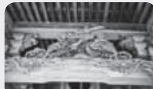
向拝 精巧な彫刻が見どころ

大正3年（1914）に建立された本堂は、建物の造りもさることながら、特に内外の装飾彫刻に目を引かれます。作者は、伝承及び作風から、秋田県中仙町豊川（現：