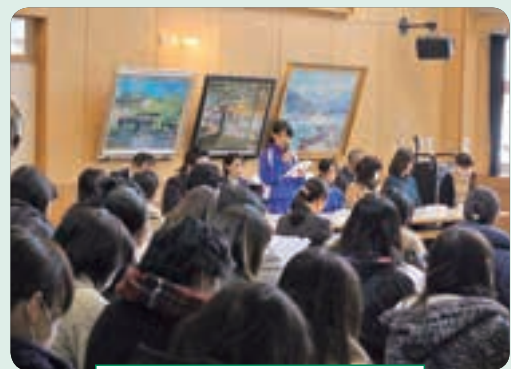
御所小学校実践区推進会議の様子

2月15日、御所小学校を会場に御所小学校実践区推進会議が開催され、1年間の活動報告を行いました。会議には約100人参加し、学校の課題を5者でともに解決していくために、取り組み内容を明確にして、地域の理解と協力を得ながら様々な活動を展開しました。みんなで活動を振り返りながら、来年度につなげる大切な会議となりました。