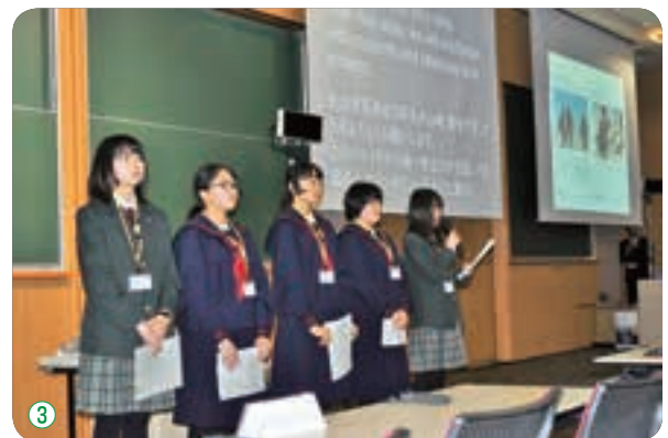
① バーデン・ヴィルテンベルク州議会を表敬訪問（シュトゥットガルト） ② ドイツオリンピックスポーツ連盟を表敬訪問（フランクフルト） ③ ホストタウンサミットでの発表（東京）

これらの活動が認められ、雫石町は東京オリンピック・パラリンピック「復興ありがとうホストタウン」に登録されています。