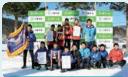
県中学校スキー大会に出場したみなさん