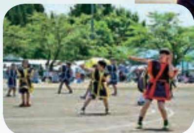
大運動会での「さんさ踊り」と「西山小唄」

記念すべき第1回大運動会では、旧下長山小学校で取り組んできた「西山小唄」と旧西根小学校で取り組んできた「さんさ踊り」を披露しました。練習では、統合前の学校の子どもたちが先生役となり一つの目標に向かって進む姿を見せてくれました。新しい学校のスタートとしてふさわしい取り組みとなりました。