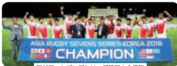
アジア・セブンズシリーズ韓国大会優勝

【(川)】日本代表になった際には、「仲間やチームスタッフを信頼すること」とよく言われていました。何のスポーツでも、信頼し合わないとは何もできないと思います。今までやってきたことを信頼してパフォーマンスすればいい結果につながると思いますし、たとえダメだったとしても、その後の将来につながると思うので、信頼することを大切にしてほしいです。