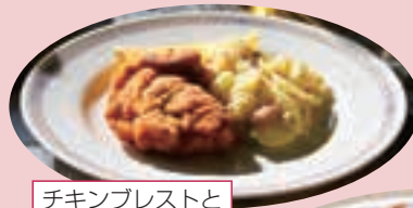
チキンプレストとポテトサラダ