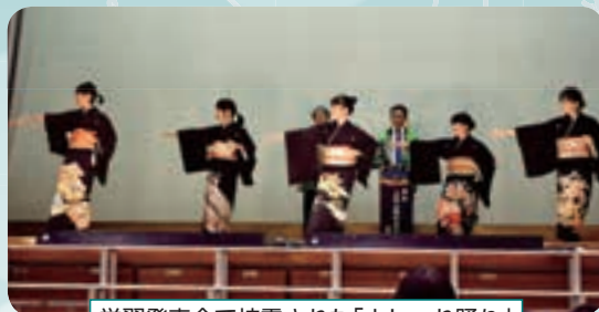
学習発表会で披露された「よしゃれ踊り」

それぞれの学校には、これまで続けられてきた伝承活動があり、統合初年度の学校行事で披露しました。