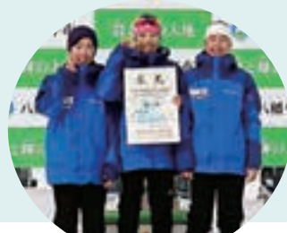
見事優勝に輝いた クロスカントリー女子リレーメンバー