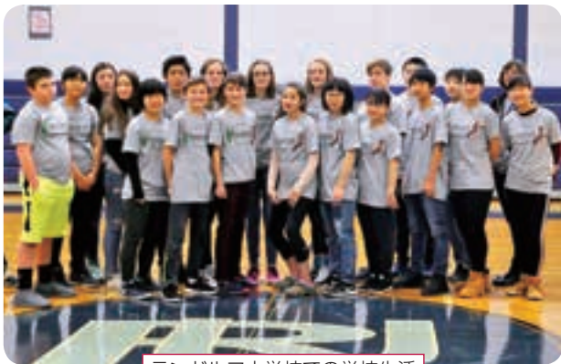
ランドルフ中学校での学校生活

1月4日～14日に行われた国際交流海外派遣の派遣団が帰町報告を行いました。栗石中学校生徒10名と引率教員は、ランドルフ中学校での授業体験やプレゼン発表、ホームステイ、小学校訪問など、様々なことをアメリカ合衆国で体験しました。生徒たちはそこから学んだことを町長に一人ずつ発表し、コミュニケーション能力や語学力の向上など、それぞれが成長した姿を見せました。