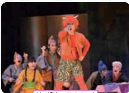
演劇「泣いた赤おに」

子供たちの豊かな感性をはぐくむため毎年開催しています。演劇、ミュージカル、クラシック音楽や伝統芸能などの多彩な演目が子供たちに驚きや発見、共感といった感動を届けています。本年度は、小学校低学年を対象に演劇、小学校高学年、中学生を対象にミュージカルを実施し、今回から雫石高校生も鑑賞しました。ミュージカル「夢果てるとも」では、劇中で主人公がドン・キホーテへと変身するシーンでの役者の変幻自在な演技に引き込まれるなど、ミュージカルの世界を楽しみました。