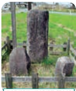
長山街道分岐の道路指導標 (写真左)

「旧秋田街道国見峠の盛岡領境石標・旧秋田街道長山街道分岐の道路指導標」が6月20日付で、町有形文化財に指定されました。