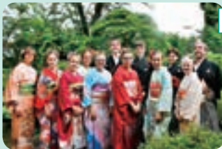
臨済寺での日本文化体験