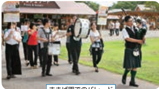
まきば園でのパレード