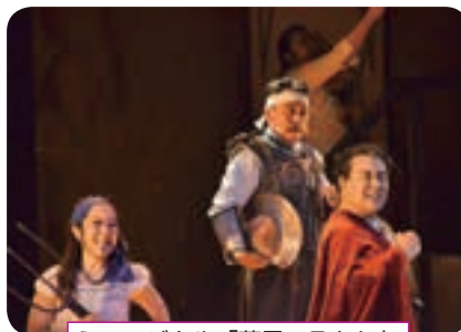
ミュージカル「夢果てるとも」