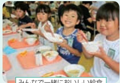
みんなで一緒においしい給食

今年度より保護者の負担軽減を図り、地域全体で子育てを支えるため、「子育て応援給食費負担金」として、町立小・中学校に在籍する児童生徒の給食費の2分の1の額を町で助成しております。将来を担う雫石の子どもたちが心身ともに健やかに成長するよう、学校給食をよりよいものにできるよう取り組んでまいりますので、ご理解とご協力をお願いいたします。