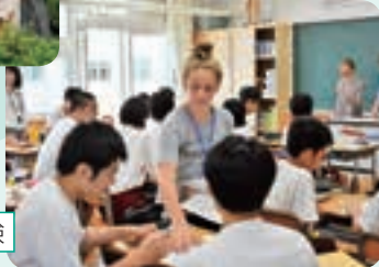
雫石中学校での授業体験

雫石中学校と国際交流姉妹校を締結しているランドルフ中学校(アメリカ合衆国バーモント州)の中学生10人、教師3人が6月28日~7月5日の8日間雫石町に滞在し、期間中は、ホストファミリーとの交流や、小・中学校での授業体験、日本文化体験などを行いました。日本文化体験では雫石高校の生徒とも交流しながら琴や習字、お茶などを体験しました。ランドルフの生徒は「お風呂や抹茶などが珍しいため興味深い、生徒がとても礼儀正しくて気さくだ」と感想を述べていました。