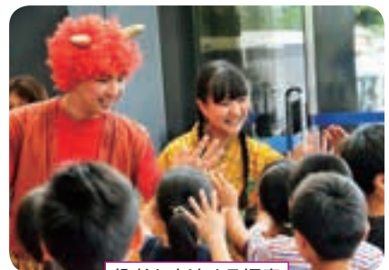
役者と交流する児童