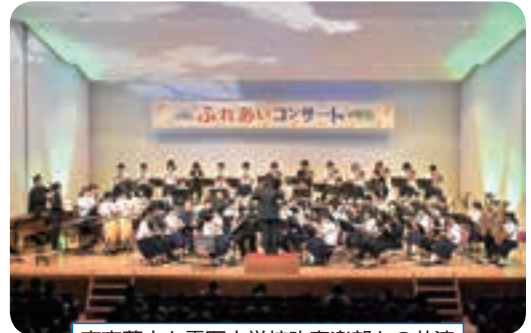
東京藝大と雫石中学校吹奏楽部との共演