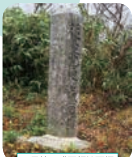
国見峠の盛岡領境石標