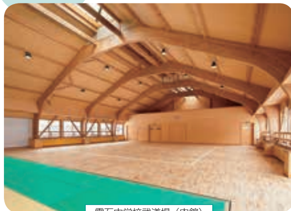
雫石中学校武道場 (内館)

雫石中学校の武道場が、木材利用の一層の推進を図るため実施された平成30年度いわて木材利用優良施設コンクールにおいて「岩手県木材需要拡大協議会会長賞」を受賞しました。