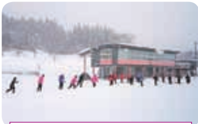
利用者でにぎわうケツパレランド