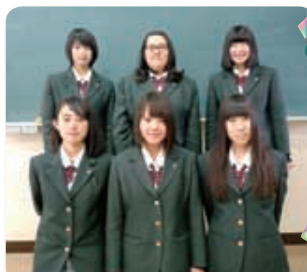
ユニット折り紙を作成した3年生のみなさん

◆3年生の『数学(数学活用)』の授業の一環でユニット折り紙を作成しました。30枚の折り紙を使用し、組み立てたものです。作品は、思郷祭に展示しましたので、ご覧になった方もいらっしゃると思います。