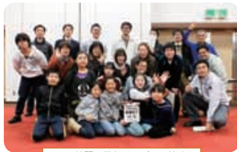
日々の練習に励むメンバーの皆さん

(岩) ぜひ見に来てください。一丸となって頑張っていますので足を運んでいただければと思います。