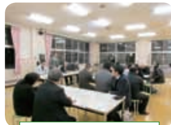
第10回御明神地区準備委員会