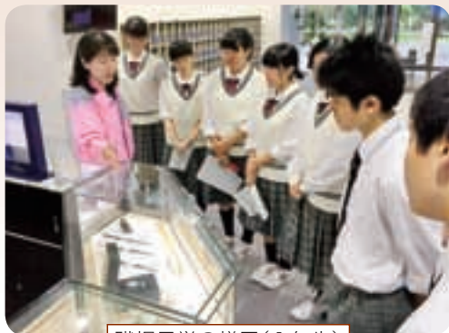
職場見学の様子(1年生)

今年の1年生は、卒業生も多数お世話になっている「盛岡セイコー工業株式会社」と、地域の情報誌等を作成している「株式会社盛岡タイムス社」の2社を訪問しました。1年生は、地域の産業に触れることにより職業意識の涵養を行い、進路意識を明確にすることを目的としています。