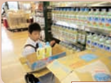
就業体験の様子(2年生)