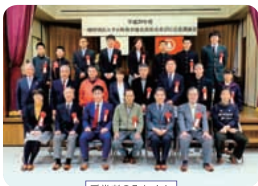
受賞者のみなさん

町総合福祉センターにおいて「平成29年度一般財団法人雫石町体育協会表彰式・記念講演会」を開催しました。