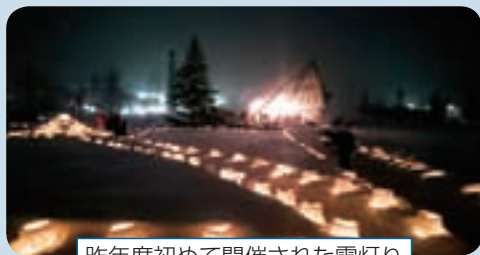
昨年度初めて開催された雪灯り