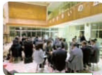
第13回西山地区準備委員会