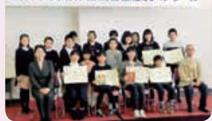
宮沢賢治作品読書感想文コンクール