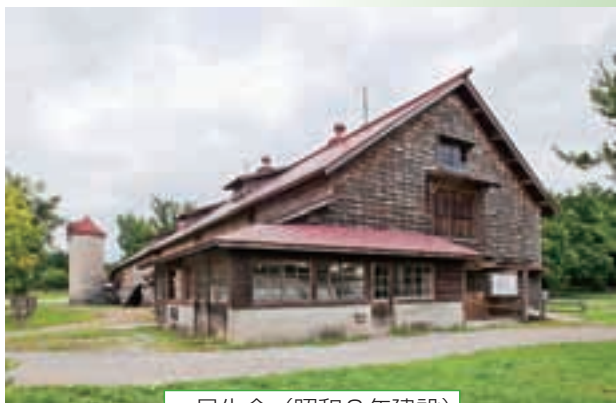
一号牛舎 (昭和9年建設)

(野) 意外と近くにいっても知らない方が多いと思うので、一度ぜひ見ていただきたいです。実際に、昔からここに人が住んで働いてきたという歴史がありますし、どうやって使ってきたかという人の歴史でもあるんですね。昔の人が作ってくれた、残してくれたものを大事に使いながらこれからも残していかなければいけないと思っています。