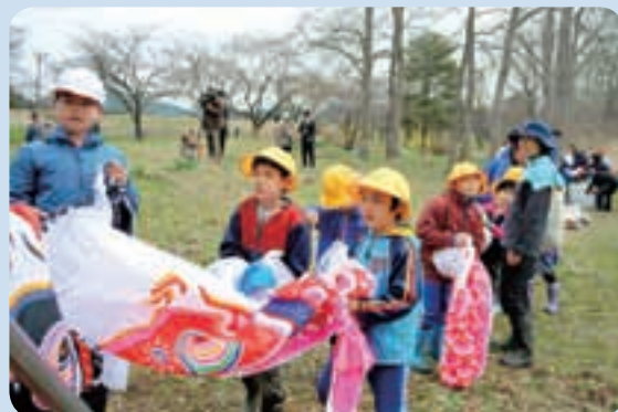
4月21日(金)に行われた掲揚式の様子

担当 栗石町教育委員会 生涯学習課 (中央公民館) TEL：019-692-4181 メール：shakyou@town.shizukuishi.iwate.jp