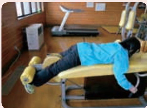
① 両脚をセットします。

前回のレッグプレスと同じく、主に両脚の筋力トレーニングに適し、太もも後面（大腿二頭筋）、でん部の最も表層にある筋肉（大殿筋）に加え、骨盤から首までの背骨の横にある筋肉（脊椎起立筋）の筋力を鍛える器具です。