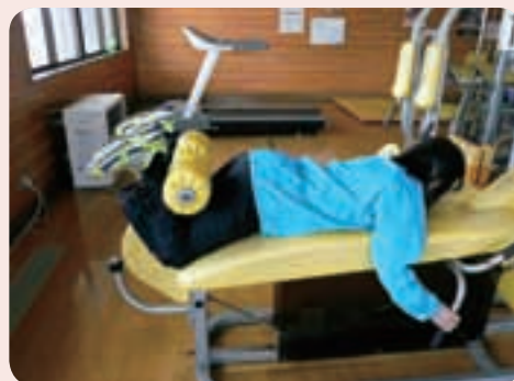
②太ももまたはでん部に器具が付くまで持ち上げます。

POINT 持ち上げるときに足首を90度に曲げると効果的です。この運動も、反動などをつけて行くとケガの原因にもなりますので注意してください。