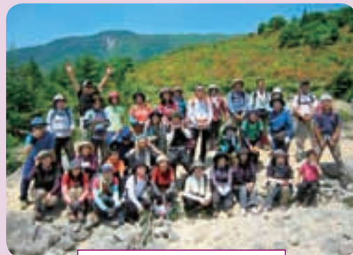
《昨年度の様子》 快晴の中、「五葉山」に登った参加者のみなさん