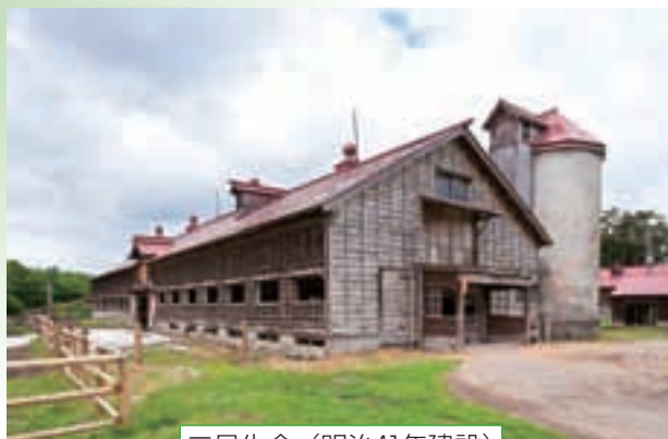
二号牛舎 (明治41年建設)