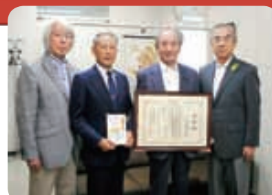
（写真左から）関事務局長、新里副会長、大村会長、吉川教育長

9月27日（火）、受賞報告のため大村会長はじめ3人が吉川教育長を表敬訪問しました。