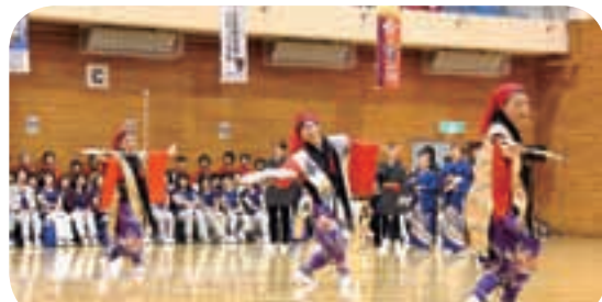
2016希望郷いわて国体デモンストレーションスポーツ3B体操でのアトラクション