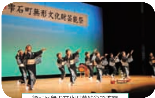
第58回無形文化財芸能祭で披露「町指定無形民俗文化財栗石よしゃれ」

(山) なんぼ自分たちが上手に踊っても、あそここうすればいいと思わさって、世話したくなる。やっぱり揃えばいいから揃わせたくてな。