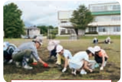
老人クラブの皆さんと一緒に草取り