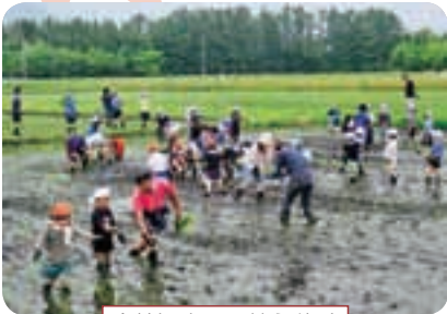
全校児童で田植え体験