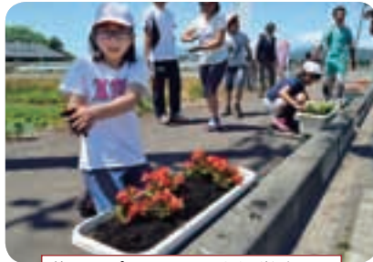
花いっぱいできれいな通学路に!