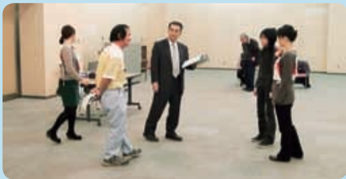
熱のこもった稽古のようす

ただ今公演に向け猛稽古中! 稽古の成果をぜひ、当日ご鑑賞ください! 前売券絶賛発売中!!