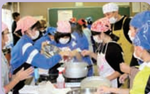
11月25日セツ森小 団子づくり

これから4ヶ月、6年生は雫中生になる準備期間という意識をもって、学習に生活に取り組んでいきます。その気持ちの高まりが感じられた小小連携交流会でした。