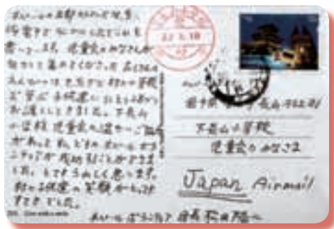
【ネパールから届いた葉書】

手紙と鉛筆・消しゴムを届けると、児童会に葉書が届きました。「…えんぴつはセティデビ村の小学校で学ぶ子供達にひとり2本ずつお渡ししてきました。…村の子供達の笑顔がとってもすてきでした」とあり、遠いネパールの学校で、下長山から送ったそれらを持って笑顔で勉強している子ども達がいると思うと、胸が温かくなり「取り組んでよかった。みんなが協力してくれてよかった」と喜び合いました。