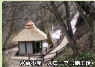
水車小屋・スロープ（施工後）