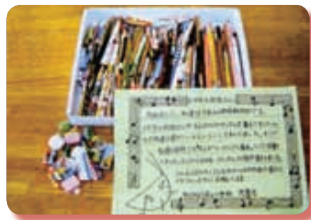
【集めた鉛筆と消しゴム】

そこで、今年は「鉛筆・消しゴム募金」に取り組みました。きっかけは、毎年ネパールに行き、メガネを届けるボランティアを10年以上続けている人がいるということを知ったことです。そして、メガネだけでなく、鉛筆や消しゴムも渡していることがわかりました。「募金以外のボランティア活動も行いたい」「自分たちができることで、人の役に立ちたい」と思っていた執行部は、全校に呼びかけ、鉛筆218本、消しゴムを31個集めました。