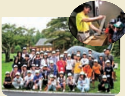
奇石博物館～ふしぎな石がいっぱい!