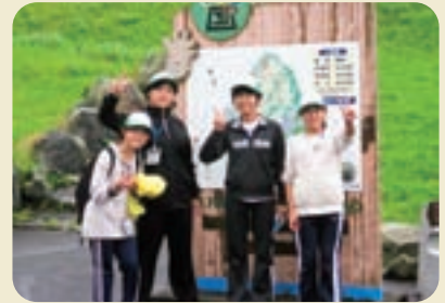
富士山こどもの国～ 広い敷地で元気いっぱい楽しみました