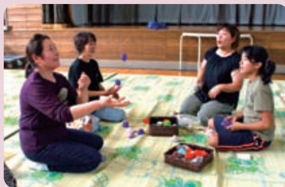
【昔の遊び(地区の祖父母の皆様)】