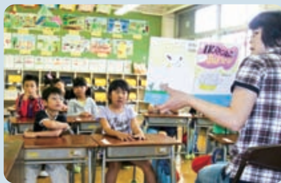
【6月に行われた朝の読み聞かせ】