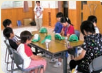
事故発生時には、全員で黙祷