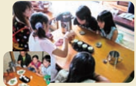
お茶の手もみ体験をした後は、 摘みたてのお茶の葉天ぷらを頂きます