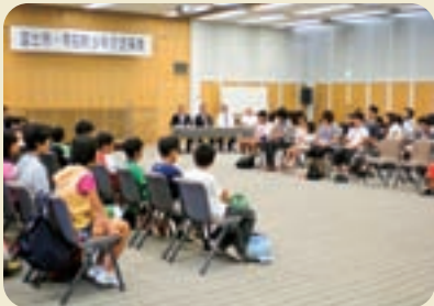
受入式～ドキドキのホームステイ先発表 今日からよろしくね!