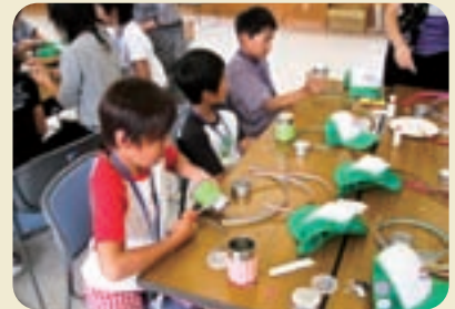
紙バンドでお茶缶を思い思いに 飾り付けしました

富士市では、富士市長・教育長をはじめ遺族・関係者の方々、ホストファミリーの皆様、教育委員会の皆様 が一体となって、4日間盛りだくさんのメニューで歓迎していただきました。