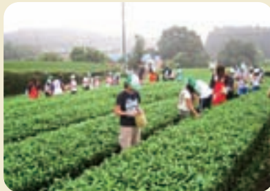
富士の茶畑～お茶娘さんと一緒に お茶つみを満喫