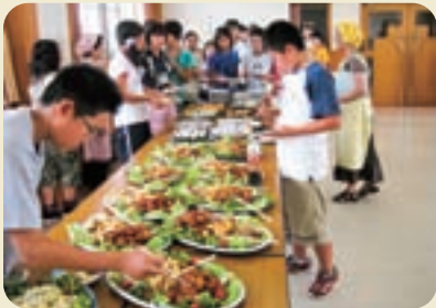
おいしい富士の郷土料理バイキング