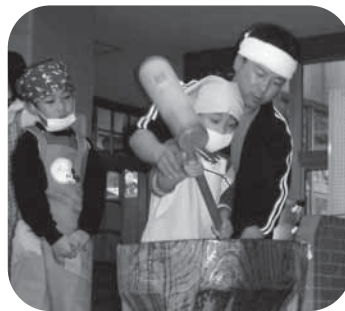
よいしょっと！餅つきに挑戦

昼頃には、全部準備が出来、いらしたお客さんと一緒においしいお餅とそばをお腹いっぱいいただきました。「毎年ごちそうになって今回で10回目です。来年も再来年もずっと来たいです。」と喜んでくださる地域の方のためにも、皆さんにご協力いただきながら来年もがんばります。