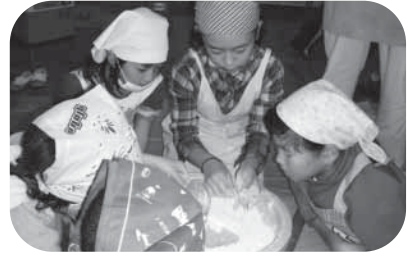
そば粉をこねていきます

その一方で、お父さん達のかけ声の下、杵を持って餅つきに挑戦です。終わると、次はそば打ち体験です。熟練のそば打ち名人の手際を真似ながらやっているうちに徐々にそばが出来ていきます。こういう体験ができるのも「橋場小ならではの」ではないでしょうか。