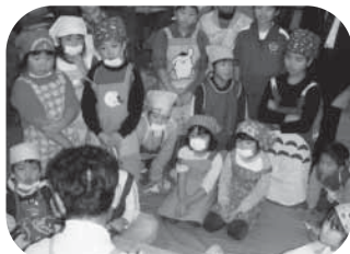
そばの作り方を熱心に聞く子ども達

当日は、朝から張り切って登校してきた子ども達と、準備や指導に続々と来校されるPTAや地域の大勢の皆さんで、小さな学校はあふれかえりました。