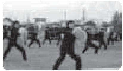
恒例、白熱の応援合戦！

もうひとつ私にとって輝いて見えるのは、生徒の指導に真摯に取り組む本校の職員です。それぞれの学級や学年で発行される通信には、生徒たちの成長を願う保護者の皆さんと同じように、愛情に満ち溢れ、成長を願う気持ちが文面を満たしています。そして、師弟同行の精神のもと指導に当たっている姿は頼もしいものがあります。