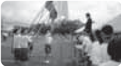
伝統の体育祭。選手宣誓！

伝統の体育祭、そして国道清掃。今、本校において今一番に輝いて見えるのは、それらの行事に意欲的に取り組む三年生の姿です。