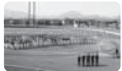
開幕式！今年も集った選手たち

去る5月3日(水)、さわやかな五月晴れの中、町内22チームによる早起き野球大会が町営球場で開幕し、熱戦の火ぶたが切られました。大会は8月の決勝までロングランで行われ、皆さんの好ゲームが期待されます。