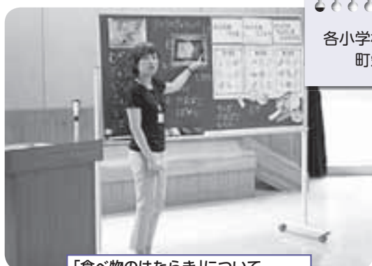
「食物のはたらき」について 安庭小学校

今年度策定された「さわやか健康しずくいし21食育推進計画(第2次)」では目指すべき状態として、「規則正しい食習慣と『早寝、早起き、朝ごはん』の生活リズムが定着し、家族や仲間と食事や料理を楽しんだり、地元食材をおいしく食べたり、郷土の食文化を知る人が増え、生涯を通じて健やかに暮らせる健康な人が増える」としており、これに向けて食に関する指導も行なっています。また、学校給食で使用する野菜の地場産割合を高めることも目標としており、積極的な地場産物の使用を進めています。