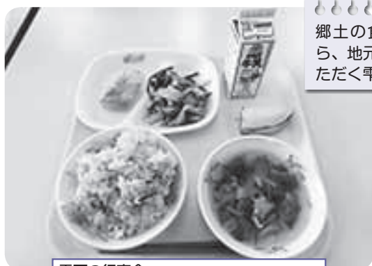
雫石の行事食 田植えが終わったお祝い「さなぶり」献立

成長期にある児童生徒に栄養バランスのよい食事を提供し、適切な栄養摂取による健康の保持増進を図ることを目的としている学校給食。岩手県内ではセンター方式の給食を実施している市町村が多い中、雫石は町内11小中学校の給食室でそれぞれ毎日作っています。給食時間が近づくにつれて校舎にいい匂いが漂うのも、学校で作り、出来立てを食べられる自校式給食ならではの魅力です。