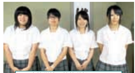
雫石高等学校 茶華道部のみなさん

10月は雫石高校の思郷祭、11月には雫石町総合芸術祭に出展します。ぜひ見に行ってください。