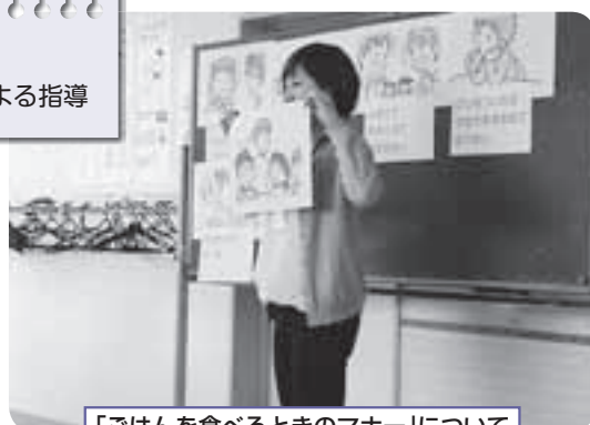
「ごはんを食べるときのマナー」について 下長山小学校