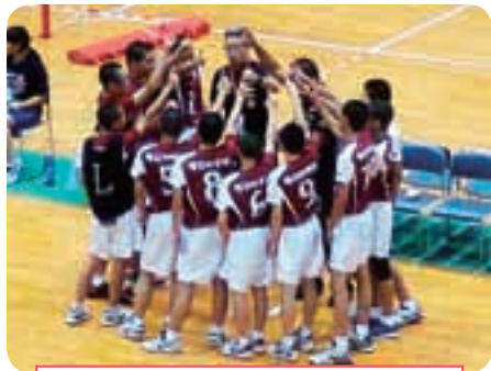
チームの心を一つにするバレーボール部

創部史上初の全国大会に挑んだ男子バレーボール部は、大分県東部中学校と準優勝した東京都駿河台中学校と予選リーグで対戦し、持てる力を出し尽くしましたが、あと一歩及びませんでした。