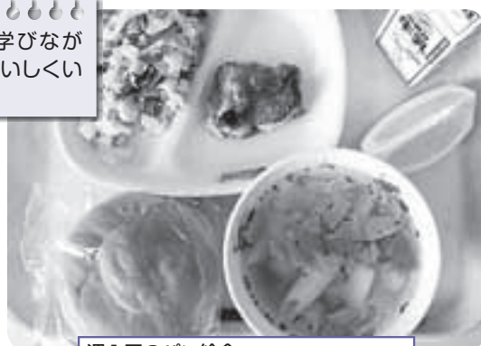
週1回のパン給食 雫石産あきたこまちを使った米粉パン