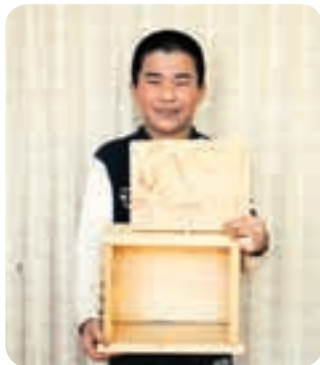
4年 千葉 朝陽 「万能木箱」

○かべかけは、小さな木片がいろいろあつたので、楽しくなって「どんぐりと山ネコ」と作りしました。木箱は、のこぎりで切ったり、くぎを打ったりするのがおもしろかったです。うまくくぎを打てないところもありました。