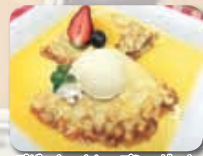
デザート・クレープシュゼット

抽選で上記メニューの引換券をそれぞれ1名様に進呈します。さあ!迷わず4ページをチェック!