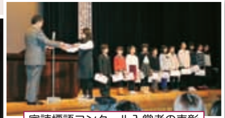
家読標語コンクール入賞者の表彰