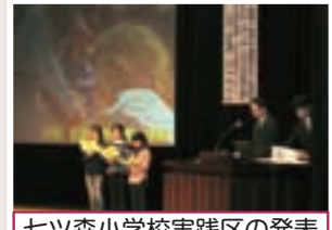
七ツ森小学校実践区の発表