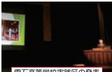
栗石高等学校実践区の発表

発表や講演に対し、熱心な質問や心温まる感想なども活発に出され、盛り上がりのある交流会となりました。