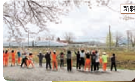
新幹線が目の前を