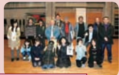
舞台での練習が始まりました! ~12月20日の稽古から~