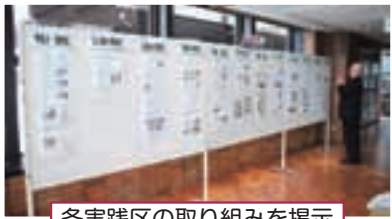
各実践区の取り組みを掲示