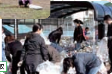
地域ぐるみの資源回収