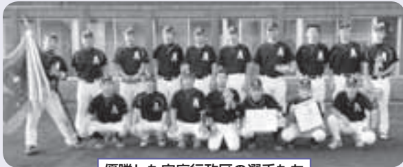
優勝した安庭行政区の選手たち