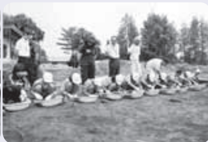
小学生の発掘体験（上長山小・H25）