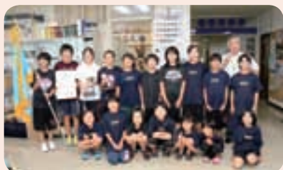
教育長に優勝を報告する団員たち

7月26日(土)～28日(月)、一関市で行われた東北電力旗第27回東北ミニバスケットボール大会岩手県大会で、雫石町ミニバスケットボールスポーツ少年団(女子)が見事初優勝しました。