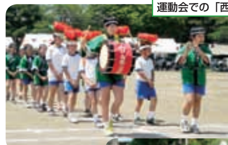
運動会での「西根さんさ踊り」

また、地域の伝統の継承や地域の活動にも意欲的で、西根さんさ踊りの指導をはじめ、地域ぐるみの資源回収や早朝環境整備（草取り）等、子どもたちと積極的にかかわり、範を示していただいています。