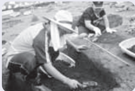
小中学生の発掘体験（少年少女歴史教室・H26）

現場では、より多くの方に昔の人々の暮らしを知っていただけるよう、普及啓発活動の一環として「現場見学」「発掘体験」「職場体験」を積極的に受け入れています。