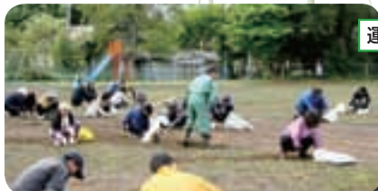
運動会前の環境整備

先ごろ開催された、教育振興運動西根小学校実践区推進委員会では、共通課題と連動したカードを使った「家読」の取り組みと独自課題「ふるさと西根に学ぶ」活動の推進が確認されました。こうして、「強く・正しく・美しく」を目指し、西根っ子は地域とともに成長しています。