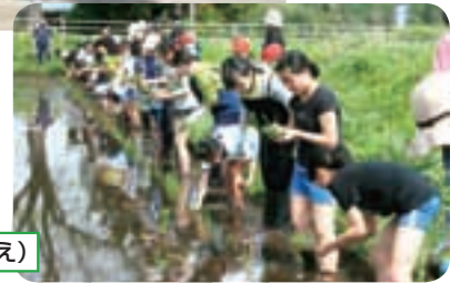
豊作を祈って（田植え）

体験活動でも、田植え→稲刈り→収穫祭という一連の活動を通して、PTA会長さん、総務委員会の方々からお世話いただきながら、米の生長や収穫の喜びを味わい、感謝の気持ちを育んでいます。また、安全面では、スクールガードの皆さんや教養安全委員会の方々に協力をいただき、登下校時の交通安全指導、見守りを行っています。変質者やクマの出没のニュースもよく聞かれる昨今、とてもありがたいと感じています。