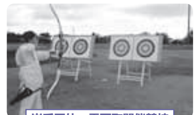
岩手国体 粟石町開催競技「アーチェリー」

今、東日本大震災からの復興、さらには、本町に大きな被害をもたらした大雨災害からの復興に向けた活動に多くの人が取り組んでおり、人と人との「絆」の大切さを改めて強く教えられました。