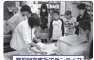
学校図書支援ボランティア