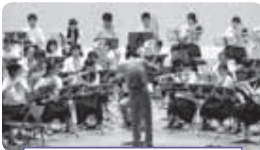
ふれあいコンサート in 粟石

文化芸術は、日常的な楽しさや感動を通じて生活にゆとりをもたらし、人々に生きる喜びを与え、潤いのある人生を送る上で大きな力となります。