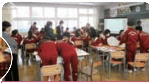
スーパーエコスクール実証事業ワークショップ