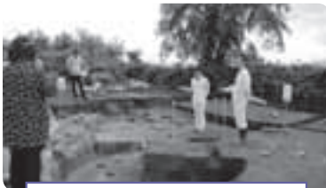
小日谷地遺跡発掘調査説明会