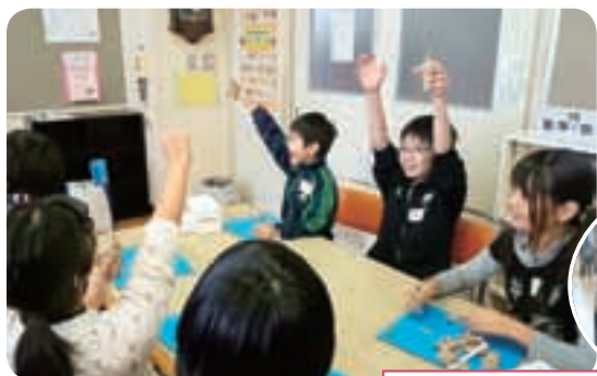
小・小連携交流会