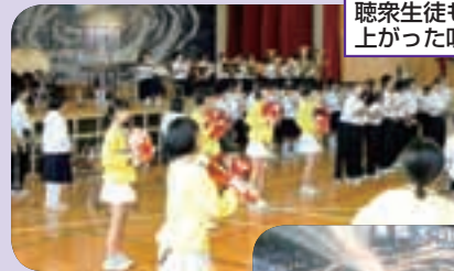
聴衆生徒も参加し、大いに盛り 上がった吹奏楽コンサート