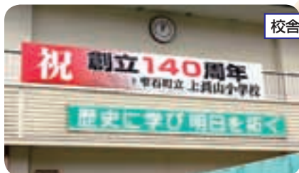
校舎に掲げられた記念看板

今年の運動会は創立140周年記念大運動会として、PTAや地域の皆様にご協力、ご支援いただきながら開催しました。広い校庭では、午前中は小学校の運動会、午後は地区民運動会が行われ、学校行事を応援して下さる地域の方々と各地区の一員として活躍する上長山の子供たちの姿が印象的でした。また、今年度は、雫石町の復興教育指定校になり「郷土を愛し、その復興・発展を支える人材の育成」をめざし取り組んでいます。7月には宮古市田老を3年生以上の児童で見学し、被災した様子や復興している街並みを胸に刻み、8月には地域の学校として岩手県防災訓練にも参加しました。これからも新たな時代を上長山小学校は歩み続けます。