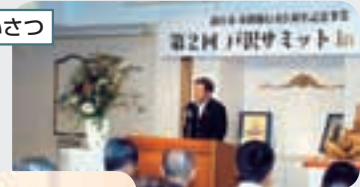
参加自治体あいさつ