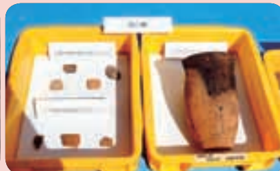
出土した遺物の展示