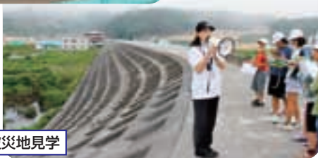
宮古市田老での被災地見学

今年の運動会は創立140周年記念大運動会として、PTAや地域の皆様にご協力、ご支援いただきながら開催しました。広い校庭では、午前中は小学校の運動会、午後は地区民運動会が行われ、学校行事を応援して下さる地域の方々と各地区の一員として活躍する上長山の子供たちの姿が印象的でした。また、今年度は、雫石町の復興教育指定校になり「郷土を愛し、その復興・発展を支える人材の育成」をめざし取り組んでいます。7月には宮古市田老を3年生以上の児童で見学し、被災した様子や復興している街並みを胸に刻み、8月には地域の学校として岩手県防災訓練にも参加しました。これからも新たな時代を上長山小学校は歩み続けます。