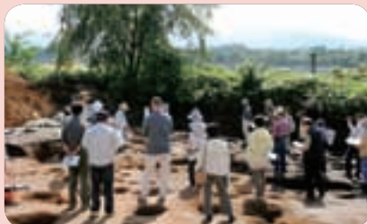
担当者の説明を聞く参加者

9月27日（土）、町中央浄水場付近に広がる縄文時代の遺跡・小日谷地IB遺跡の発掘調査現地説明会を開催しました。当日は天気にも恵まれ、町内外から約25人の参加者を迎え、9回目となる今年度の調査結果について、担当者から説明がされました。今回初めて「翡翠（ひすい）」と見られる石などが見つかっており、参加者はそれらの貴重な遺物を熱心に観察していました。