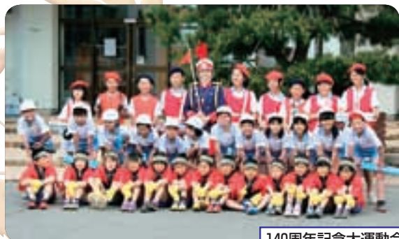
140周年記念大運動会

上長山小学校は今年度で学校創立140周年を迎える歴史ある学校です。明治7年、地域の文教の礎としての長山小学校が開校しました。その後、早坂小学校、上長山小学校と改称しながら時代とともに歩んできました。現在の校舎は昭和59年に建てられ、30年以上経ちますが、1年生から6年生が縦割り班で協力して清掃活動を行っているため、校舎やその周辺はとても綺麗です。そして校舎の2階、校庭から間近に見える秀峰「岩手山」はいつも優しく学校や子どもたちを見守ってくれます。