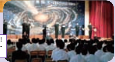
雫中魂ここにあり！ 一糸乱れぬ応援団・ チア発表

その他、「吹奏楽部コンサート」、「わたしの主張」、「英語弁論」、「応援団・チア」発表などが行われ、聴衆生徒とチアリーダーと一緒に踊ったダンスなど、工夫を凝らした内容で盛り上がりました。