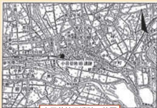
小日谷地IB遺跡の位置

小日谷地IB遺跡は、雫石町小日谷地にあり、町中央浄水場付近を中心とする縄文時代の遺跡で、近所の人々には昔から土器や石器が出る場所として知られていたようです。