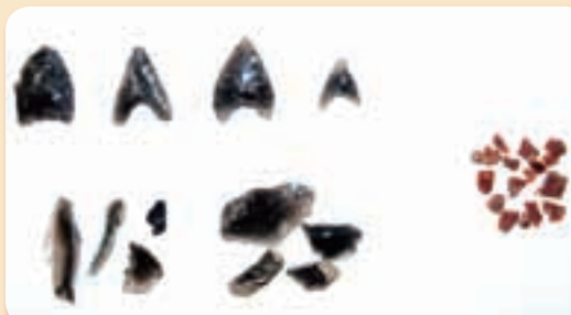
左：黒曜石の矢じりと剥片 右：琥珀の破片

黒曜石とは、ガラスによく似て黒光りする石で、国内100か所ほどの産地が知られています。その1か所が実は雫石町内にあり、雫石産と推測されるものが、なんと青森県の三内丸山遺跡からも出土しています。