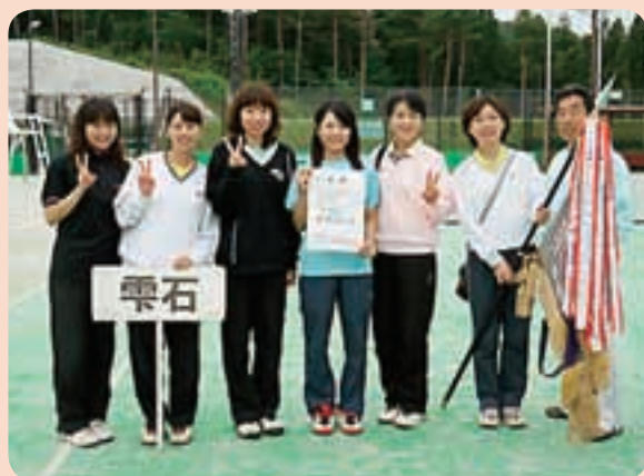
優勝した女子チームのメンバー

雫石町女子チームは、平成23年に優勝、24年は準優勝と、近年継続して高い成績を収めています。来年の活躍も大いに期待されます。