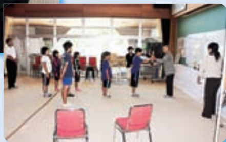
南畑小学校での贈呈の様子