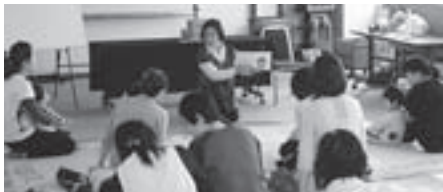
たんぽぽおはなし会の皆さんがみんなを待ってまーす！

絵本の読み聞かせ、紙芝居、パネルシアター、工作♪ できた作品（工作）は、その日の記念に持ち帰れます。 毎月第3木曜日の10時30分から中央公民館2Fの視聴覚 教室で開催中！次回は9月20日（木）です。