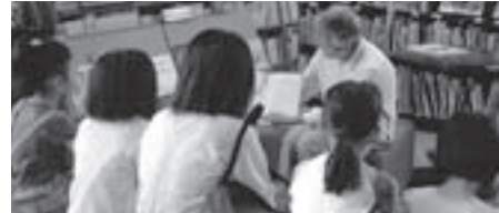
おはなしの雫の皆さんがみんなを待ってまーす！