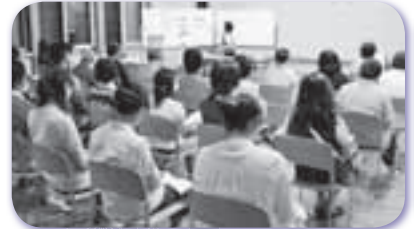
地区子育て講演会