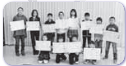
実践交流会(家読標語表彰)

教育振興運動の取り組みの様子は今年度も毎月お伝えします。【問い合わせ】社会教育課（692-6590）