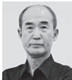
〈俳優・斎藤晴彦氏〉