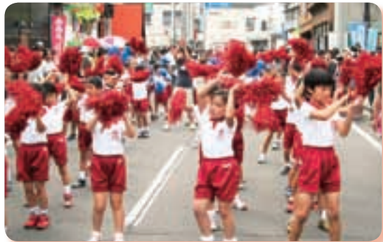
《1・2年生 ロック調よしゃれ》

また、本校の取組みの一つとして地域貢献があげられます。「自分達の出来ることで地域貢献」を合言葉とし、1・2年生は、よしゃれ祭りにおいて「ロック調よしゃれ」の演舞で祭りを盛り上げました。