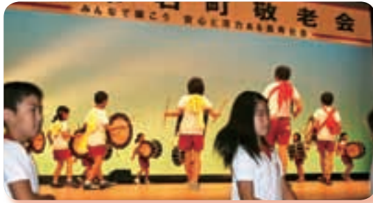
《3・4年生 さんさ踊り》

5・6年生では「雫石を守る つくる」をテーマにキャリア教育やソーシャルスキルを学んでいます。