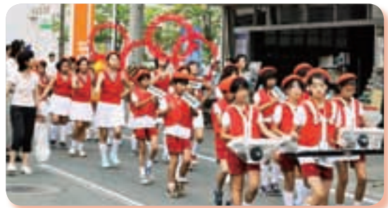
《5・6年生 交通安全パレード》