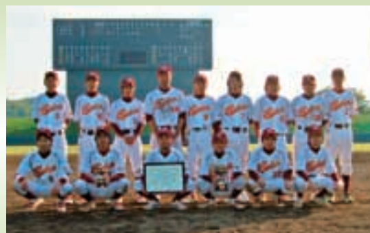
《準優勝を収めた「リラックス」のメンバー》