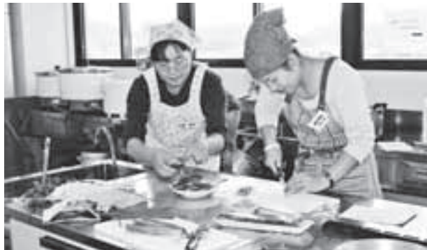
〈こんな感じで楽しく作る 健康料理!〉