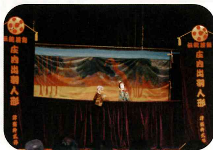
庄内出羽人形芝居のユーモラスな動き