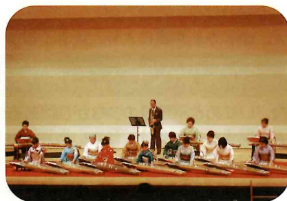
見事な箏曲とトランペットのコラボ