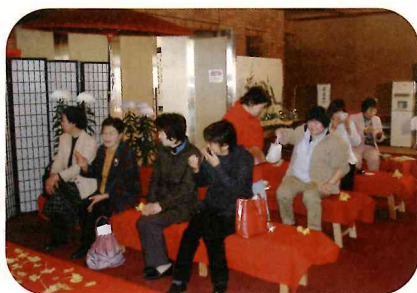
連日大盛況のお茶席