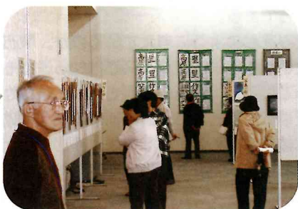
小中学校の作品も展示

町民の優れた芸術文化活動の成果を展示・発表し、鑑賞の機会を広く提供する目的で毎年開催している総合芸術祭! 43回を迎えた今年は、展示部門では絵画・書道など、165人から合計492点が出品され、舞台部門では、ピアノ・コーラスなどで131人が出演しました。今年は、展示部門に小中学校作品展が復活したこともあって、多くの家族連れが訪れ、3日間で舞台・展示部門合わせて1,300人を超える来場者でにぎわいました。