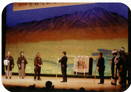
昔の婚礼の風景 長持唄