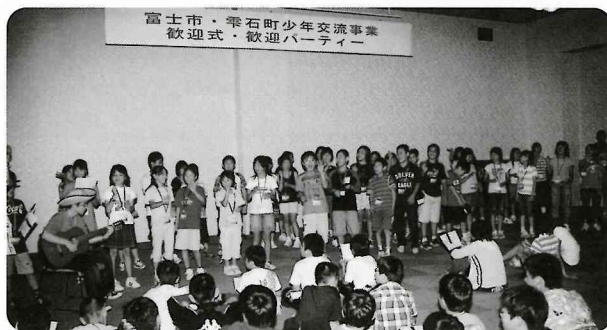
笑顔がいっぱい！ウェルカムパーティー

この4日間を通して、先に設立されたジュニアリーダー（中学生）の組織である「SKY」のみなさんが事業を盛り上げてくれました。また、ホームステイ引受家庭の皆さんをはじめ、関係者の皆さん、事業を成功に導いていただき、本当にありがとうございました。