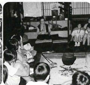
曲り家での昔話聴講