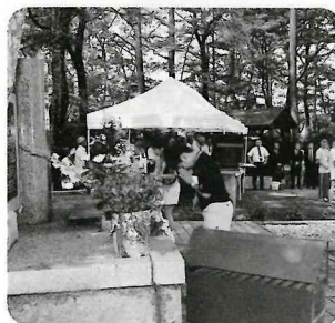
慰霊の森での拝礼