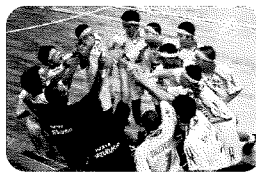
見事東北大会出場を決めた 県中男子バレー部