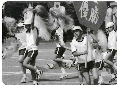
低学年も高学年も一致団結の応援合戦

んだ。」優しく頭をなでてあげる6年生と、得意な1年生の笑顔がきらきら輝いていました。