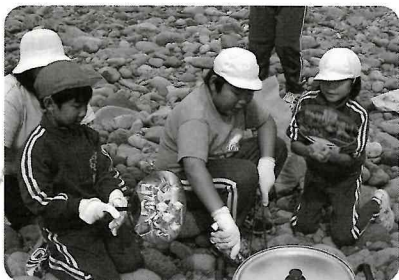
火が消えるぞ。あおげあおげ！ 全校炊事遠足

3年前、縦割り班による清掃に取り組んだことがきっかけになり、今では上級生と下級生の間がりの強さが学校生活を支える大きな力となっています。