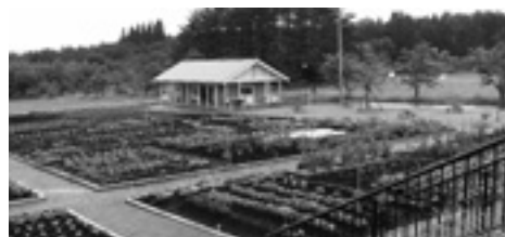
コテージむら体験農園