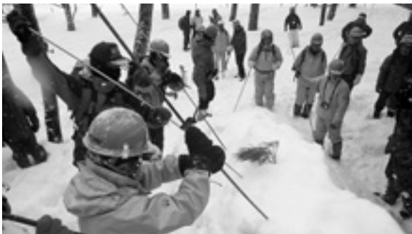
ゾンデ棒を使用した捜索訓練を行う参加隊員

2月23日、滝沢市内の相の沢キャンプ場で南岩手山岳遭難対策委員会主催による冬季遭難対策合同訓練が実施されました。訓練には、当町、盛岡市、滝沢市の各救助隊、盛岡西警察署、盛岡西消防署、陸上自衛隊岩手駐屯地が参加。岩手山に山スキーに出掛けた家族3人が戻らないという想定で、雪洞などのビバーク施設の構築や、ゾンデ棒と電子機器を使用し、雪崩に巻き込まれた要救助者の捜索訓練が行われ、非常事態への対応を確認しました。