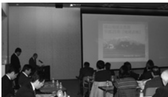
地域点検の事例発表者と話を熱心に聞き入る参加者

2月22日、コミュニティ組織とコミュニティ組織未設置行政区の合同研修会が、相互の連携と親睦を深め地域の自治能力の向上を図ることを目的に中央公民館で開催されました。