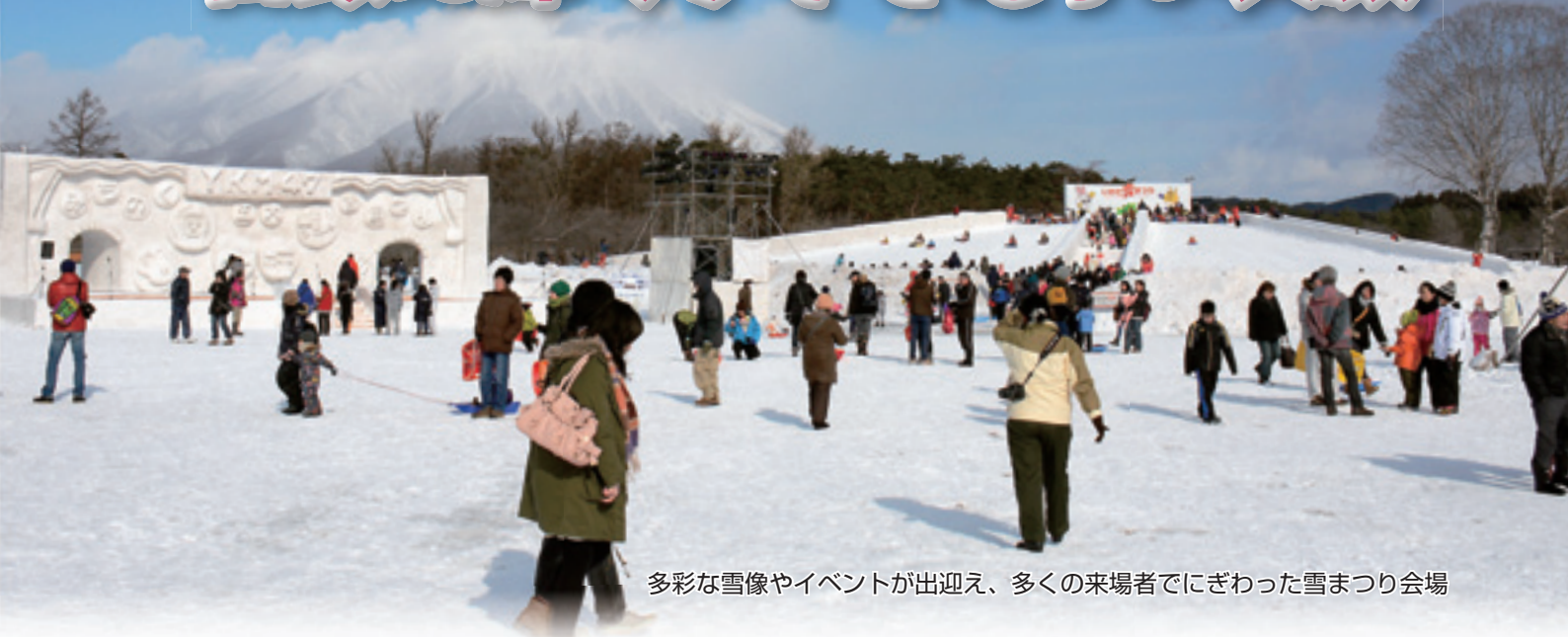
多彩な雪像やイベントが出迎え、多くの来場者でにぎわった雪まつり会場