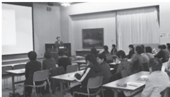
講師の話に真剣に耳を傾ける参加者

今回は太陽光発電などのクリーンエネルギーによる地球温暖化防止についての講演や、町の環境事業の取り組みについての報告が行われ、41人の女性参加者は真剣に耳を傾けていました。