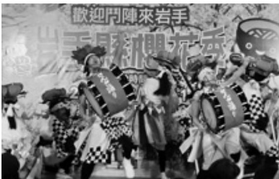
台北駅で上駒木野さんなどを披露する雫高郷土芸能委員会

4月からのチャーター便を活用した台湾旅行は価格もこれまでより低く設定されていることもあり、満席の便も発生しているようですので、台湾への旅行を検討されている場合は、お早めに各旅行会社にお問い合わせください。