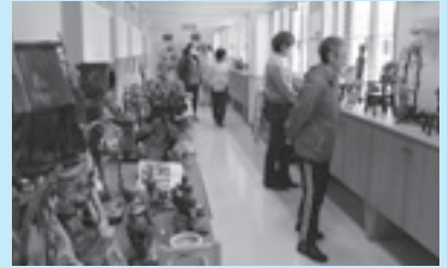
町内工芸作家の力作が並ぶ春の工房まつり

知症などの相談に専門家が応じま す。相談は無料で、秘密は厳守し ます。お気軽にご相談ください。