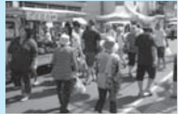
毎回多くの買い物客でにぎわいを見せる軽トラ市

各出店者や商店街では、もっともっと来場者に楽しんでいただくこと、「しずくちゃん&ケキヨきちジャンケン大会」のほか、さまざまな企画を用意しています。エンジン全開で元気に走り続ける「元祖軽トラ市」にどうぞ