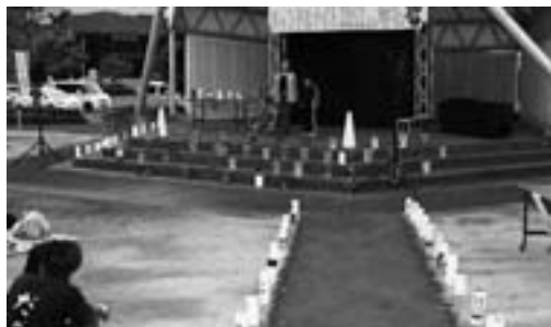
イベント中、会場をやさしい光りで照らす夢あかり