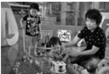
つどいの広場で親子のふれあいを