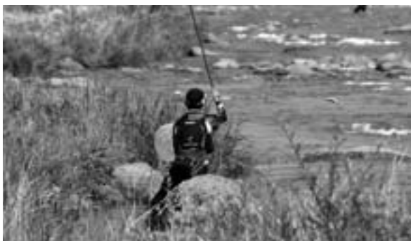
自慢の腕前を披露する参加者