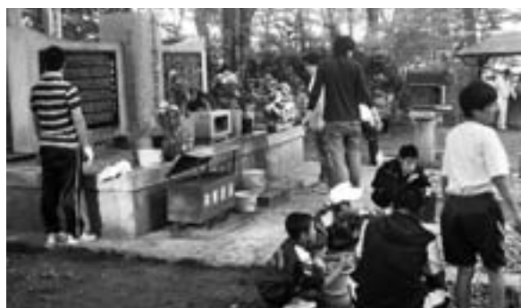
慰霊碑の清掃を行う参加者