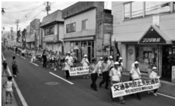
約300人が参加し行われた夏の防犯交通安全パレード

また、雫石地区防犯交通安全協会では、7月26日に夏の防犯交通安全パレードを実施。協会関係者や雫石地区老人クラブ、雫石小学校鼓笛隊など約300人が参加し、横断幕やのぼり旗を掲げて雫石中学校から下町一行政区までの約1キロを歩き、防犯交通安全を沿道の人たちに呼びかけました。