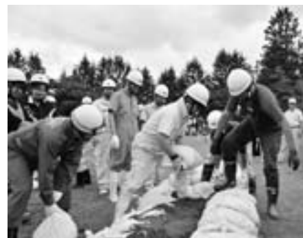
自主防災組織と消防団による水防工法訓練（昨年の防災訓練から）

※当日は、9時15分から10時まで春木場中心部と春木場橋が訓練のため交通規制されます。皆さんのご理解とご協力をお願いします。 【日時】9月2日（日）、8時45分～ 【場所】春木場地区、雫石川（竜川）河川敷、御明神公民館ほか 【訓練内容】○火災通報 ○避難誘導 ○火災防備 ○避難勧告 ○エリアメール配信 ○避難所開設 ○炊き出し ○給水 ○水防工法 ○倒壊建物救出救護 ○応急救護所開設 ○応急処置 ○傷病者トリアージ など 【問い合わせ先】 町役場防災課消防交通担当（☎692・6490）