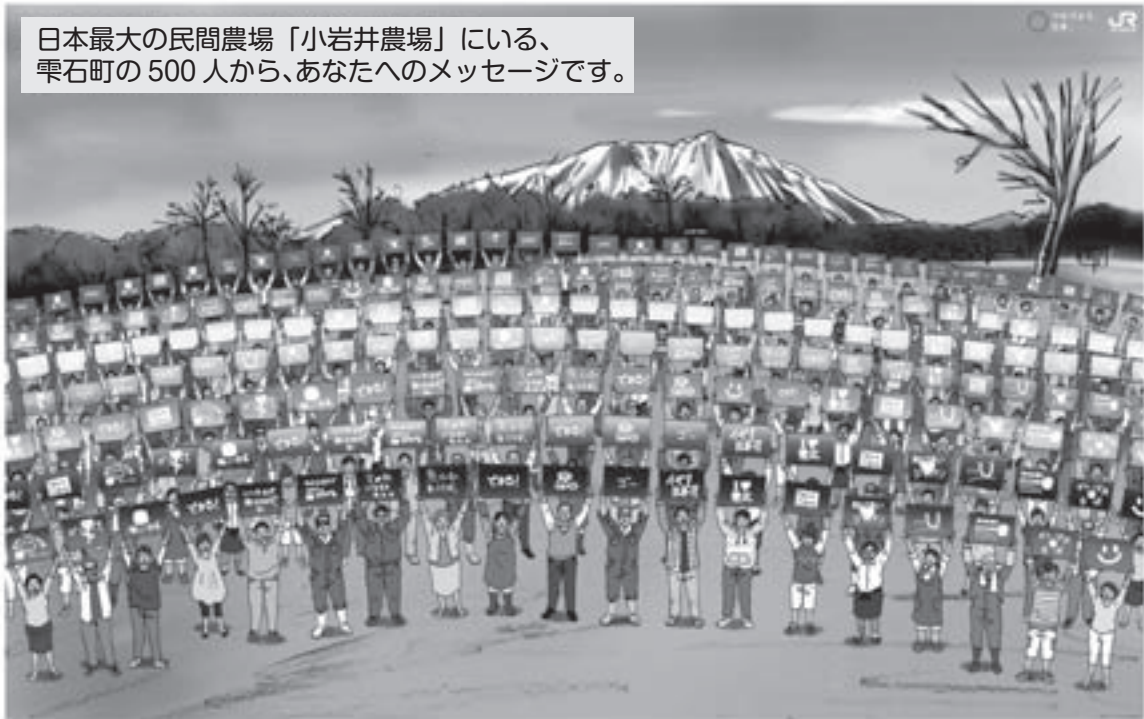
日本最大の民間農場「小岩井農場」にいる、雫石町の500人から、あなたへのメッセージです。

いわてデスティネーションキャンペーン 2012.4.1sun → 6.30 sat