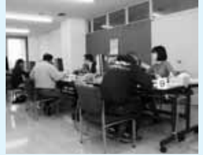
昨年の申告相談会場

◆町県民税の申告相談は、町役場3階大会議室で2月4日から3月15日まで左表1の「申告相談日程表」により行います。日によって対象地区を指定しています。できるだけ指定日にお越しください。