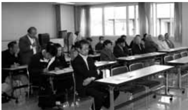
皆様のご意見をお聴かせください