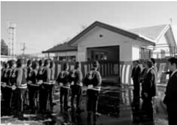
屯所と公民館の機能を併せ持つ五区コミュニティ消防センター

当日は、餅まきなどが行われ、地域防災と地域コミュニティの拠点となる同センターの完成を祝いました。