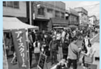
町内外からの来場者でにぎわう軽トラ市

また、今回の芸能イベントでは、恒例となった昔語りと音楽ライブをはじめ、雫石高校郷土芸能委員会によ