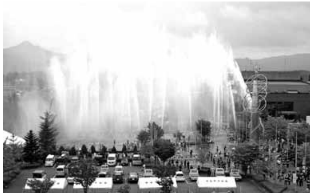
消防車両18台による迫力の放水訓練（昨年の消防演習から）