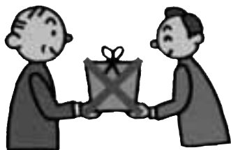
政治家は有権者に寄付を 贈らない