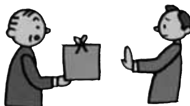
政治家から有権者への寄付は 受け取らない

政治家(候補者、立候補予定者、現に公職にある者)と私たち有権者とのつながりはとても大切です。しかし、金銭や品物で関係が培われるようでは、いつまでたっても明るい選挙、お金のかからない選挙に近づくことはできません。「贈らない」「求めない」「受け取らない」の3ない運動を徹底しましょう。選挙の有無にかかわらず、政治家が選挙区内の人に寄付を行うことは、特定の場合を除いて一切禁止されています。有権者が求めてもいけません。冠婚葬祭などの贈答も寄付になるので注意してください。