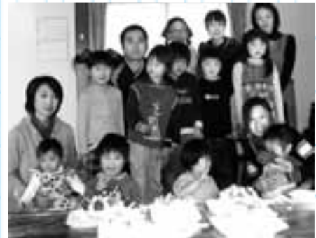
12月に開催したクリスマス会

子どもも増えてきました。昨年十二月には子どもたちと一緒にクリスマス会を開催し、一緒にケーキを作りながら楽しく過ごすことができました。また今後は、「事業仕分け」もやっつけていこうと考えています。みんなで話し合い、検討しながら、道路脇へのプランターの設置や花壇の拡大、ふれあいサロンの設置などにも挑戦していきたいです。