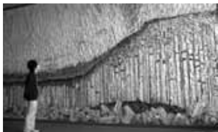
玄武洞を描いた大理石のモザイク壁画