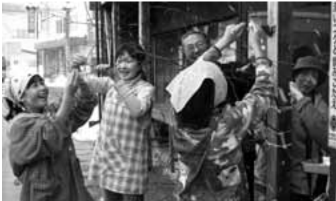
ミズキに色鮮やかな団子を付ける児童

1月13日、雫石昔っこ語り隊(石井浩一会長)は、雫石わらしゃんど語り教室の子どもたちと、五穀豊穡などを祈願する小正月行事、ミズキ団子作りを行いました。児童らは、参加した語り隊メンバーから指導を受けながら団子作りに挑戦。鮮やかに色づけした花やイチゴをかたどった団子をミズキの枝の一つずつ丁寧に付けました。児童からは「難しかったけど、上手にできた」などの感想が話されました。また、2月21日には、児童たちの昔語りを披露する発表会を同館にて開催することので、多くの来場を呼びかけています。