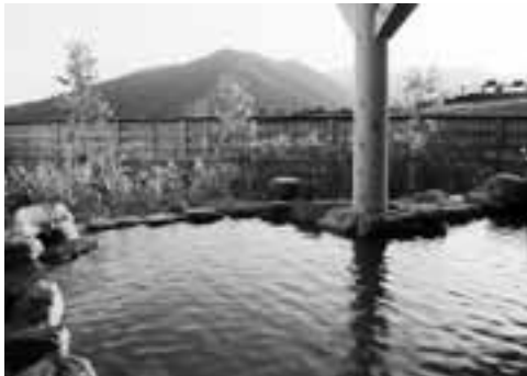
自然に囲まれたさまざまな温泉をお楽しみください