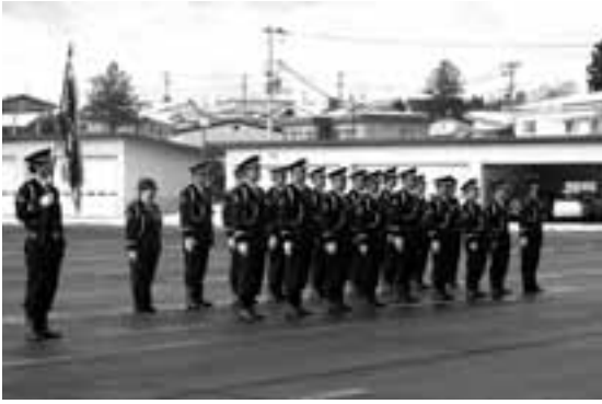
初点検式に臨む交通指導隊