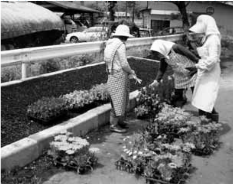
昨年6月、地域住民20人ほどが参加したペゴニア、サルビアなどの植栽

土橋行政区では、昨年六月に自治会を立ち上げました。行政区長に任せっきりだった地域の仕事を、みんなで取り組もうと「チェンジ チャレンジ みんなでやろうぜ」のスローガンを掲げ、さまざまな活動に挑戦しています。その一つが花壇の花植えです。昨年六月自治会立ち上げを機に、建築会社から廃材をもらうなどして、なるべくお金を使わない形で花壇を設置しました。花壇の横には、四人ほどが座れるベンチを二脚設置。高齢者などが散歩がてらに休憩できる「憩いのオアシス」として利用されています。