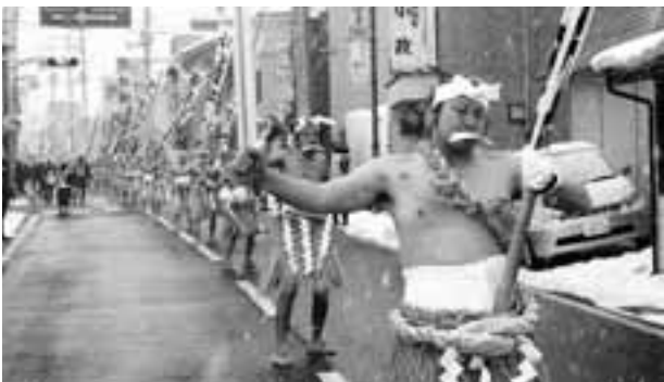
足並みをそろえてゆっくりと歩を進める祈願者

五穀豊穡や家内安全、商売繁盛などを祈願する雫石冬の風物詩、裸参りが1月17日に行われました。古式にのっとった装束に身を包んだ31人の若者が、上町の三社座神社から下町の永昌時まで約1.2キロの道のりをゆっくりと祈願しながら歩きました。今年は、途中雪が降るなど祈願者には厳しい裸参りとなりましたが、沿道には勇姿を一目見ようとする町民や、珍しい風物詩をカメラに収めようとする人らが多く駆けつけ、祈願者を勇気づけました。