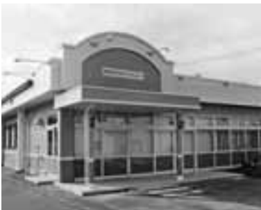
4月オープン予定の雫石町まちおこしセンター

【応募先】町役場産業振興課商工労働担当（〒020・0595 雫石町千刈田5番地1 ☎692・6497 FAX692・1311）