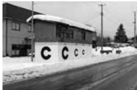
おりつめ木工の目印になっている「C」のマーク