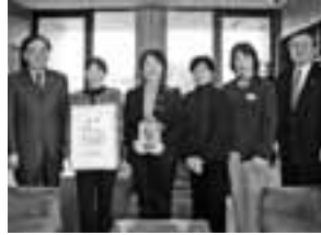
むら・もり・うみ女性アグリビジネス活動表彰を受けたふれあい青空市友の会

間地域モデル賞として戸沢集落、むら・もり・うみ女性アグリビジネス活動表彰としてJA新いわて女性部雫石中央支部ふれあい青空市友の会が表彰を受けました。※写真は、町に表彰受賞の報告に訪れた際のものです。