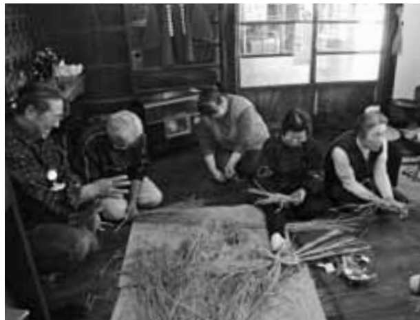
悪戦苦闘しながらも真剣な表情で縄をなう参加者

昔語り館で12月27日、しめ飾り・わら細工教室が開催され、約15人が参加しました。いろいろを囲んで、稲わらで縄をない、豆、煮干し、昆布、みかんなどで飾り付けをしました。縄をなうのが始めての人は、なかなか思うようにできず四苦八苦しながらの作業でしたが、参加した皆さんは自分で作ったしめ飾りの出来に満足気でした。参加者からは「来年もみんなで作りたい」、「帰ったらもう一つ作ってみたい」などの感想が話されました。