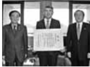
岩手県中山間地域モデル賞を受賞した戸沢集落