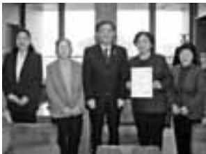
奨励賞を受賞したもち菓子加工部会