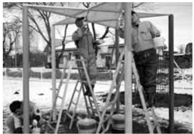
カラフルな塗装を施す商工会工業部会員

このボランティア活動は、地域貢献活動の一環として、町内の児童施設を訪問し、昨年度から実施しているものです。