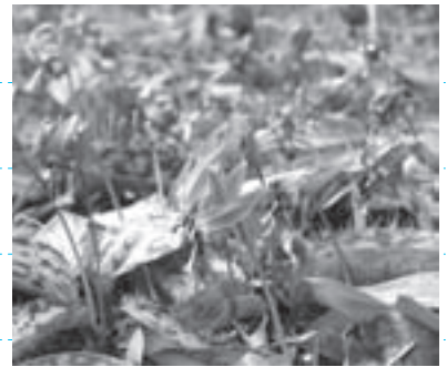
逢滝付近に群生するカタクリ

四季折々の様々な景色を見せる鶯宿温泉。まさに季節の色彩が温泉のようにあふれています。