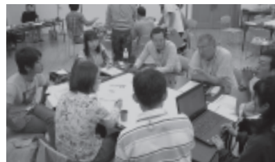
受講生によるグループワークの様子

るファシリテーター、地域の後継者としての役割など、さまざまな地域づくり活動への参画が期待されます。