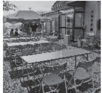
事業で購入されたテント・テーブル・イスなど

平成 29 年度は土橋自治会のテントなどコミュニティ活動の備品整備事業が採択され、夏まつりや子ども会の実施のための音響機材・テント・テーブル・イスなどの購入に充てられたり、敬老会やふれあいサロンなど、お年寄りの集いの場を快適な環境にするため、テーブルやイスなどの備品購入費として活用されました。