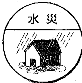
洪水や床上浸水など