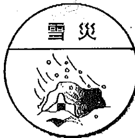
大雪やなだれなど