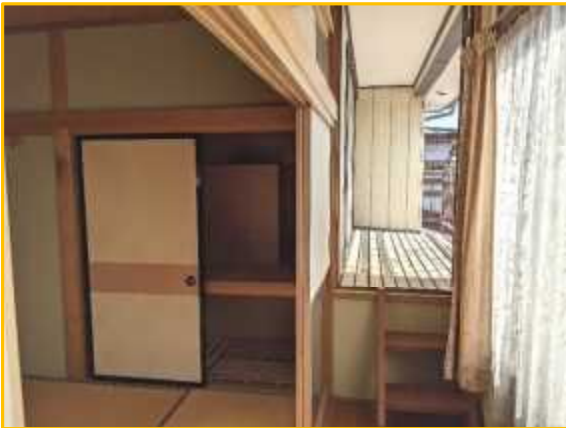
2F 和室③押入れ、テラス