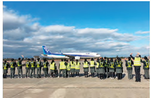
間近で見える飛行機は迫力ありますね

生徒からは「飛行機の離陸を間近で見ることができて感動した」「マナー講座で受けた内容をコミュニケーションに生かしたい」という感想が聞かれました。