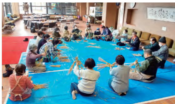
慣れない工程に四苦八苦（笑）

縄をなう作業には今年も四苦八苦しながらも、新しい年への期待を込めて丁寧に作り上げました。出来栄えに思わず笑みがこぼれました。