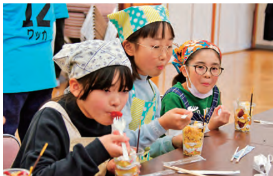
おいしい手作りケーキをみんなで食べました

雫石公民館でSKYクリスマス会が開催され、町内小学校の22人の児童が参加しました。この会はジュニアリーダーズクラブSKYが企画し、当日はメンバーの中高生7人が進行を務めました。児童はレクやダンスをしたり、カップを使ってケーキを作ったり学校や学年を超えて楽しく交流しました。子どもたちの元気いっぱいな声が響き合う賑やかなひと時となりました。