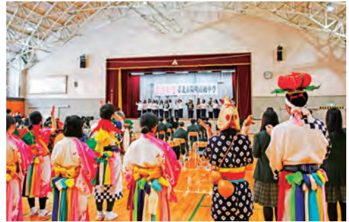
陽明高校から踊りのお返し

お土産交換や郷土芸能披露が行われた歓迎式の後、交流式としてそれぞれの学校や地域の特徴を紹介しました。同年代との交流は、雫石高校の生徒にとっても刺激になりました。