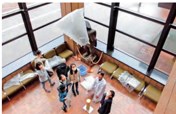
ホールロビーの天井近くまで飛びました

参加児童は、温度変化によるビーカー内の煙の動きを観察した後、気球を飛ばすモデル実験を行いました。勢いよく上昇する気球に、参加児童からは歓声が上がりました。