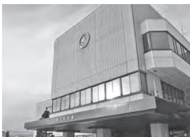
1月4日から通常どおり開庁します