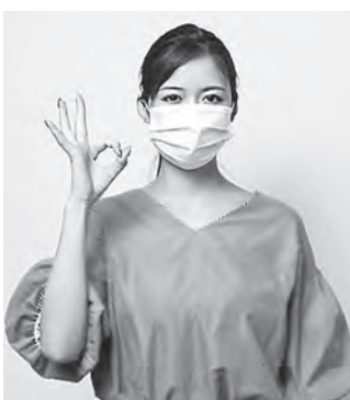
▲マスクは正しく着用を