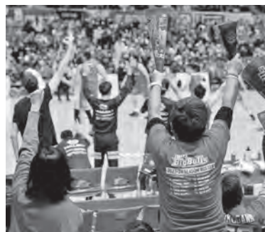
岩手ビッグブルズを応援しよう!