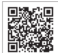
令和5年度インフルエンザ予防接種費助成について

町は、高齢者や妊婦、中学生以下の人に接種費用の一部助成を行っています。助成に関する詳しい内容は、本紙10月号や町ホームページをご覧ください。