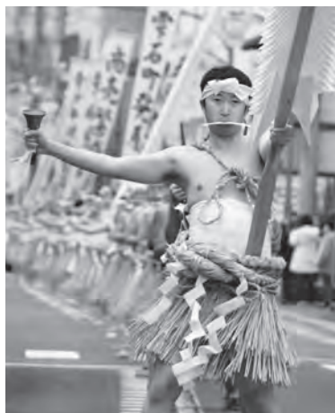
威風堂々練り歩く祈願者(2023年)

当日、上町交差点から下町永昌寺までの県道雫石東八幡平線が通行止めとなります。皆様のご理解とご協力をお願いします。