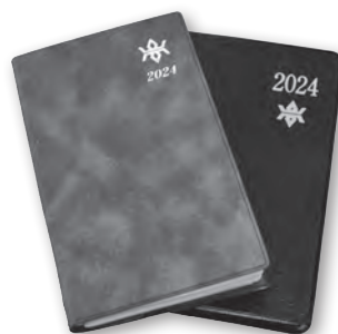
岩手県民手帳(左)と岩手県能率手帳