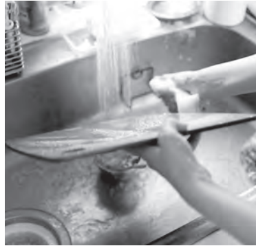
▲まな板などは常に清潔に！

帰宅後や食事前などこまめに手洗いをしましょう。アルコールを含んだ消毒液で手を消毒することも効果的です。