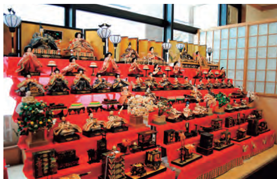
温泉館の皆さんにお披露目

道の駅雫石あねっこの温泉館で、旧小学校(西根、上長山、南畑、大村)と橋場保育所で保管されていた雛人形を展示しています。旧小学校ごとにそれぞれ作りや表情が異なる雛人形たち、この機会にぜひ足を運んでいただければと思います。展示は3月12日(日)まで。