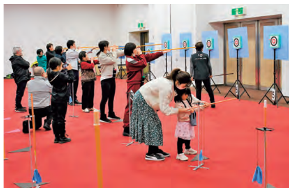
子どもから大人まで誰でも楽しめます

日本スポーツウエルネス吹矢協会を講師に、町と町スポーツ推進委員協議会の共催で体験教室を開催しました。スポーツウエルネス吹矢は、高い運動能力や、腕力など必要ないため誰でも楽しめるスポーツです。体験教室には、4歳から80代の方まで延べ44人が参加しました。参加者は「当たったときに爽快!」「年をとっても出来そうなのでまたやりたい」と楽しんだ様子でした。