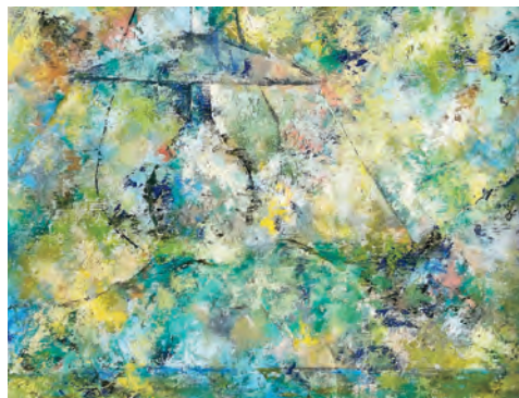
ともしび ～灯 23～

雫石町の学校給食は、自校給食といって、各小中学校に給食室があって、そこで調理員さんたちが皆さんの給食を作ってくださっているのです。そのメニューは、栄養教諭・栄養士さんたちが1か月単位で栄養のバランスを考えて、作ってくれているので