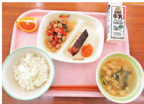
2月16日(木) 御明神小の給食献立