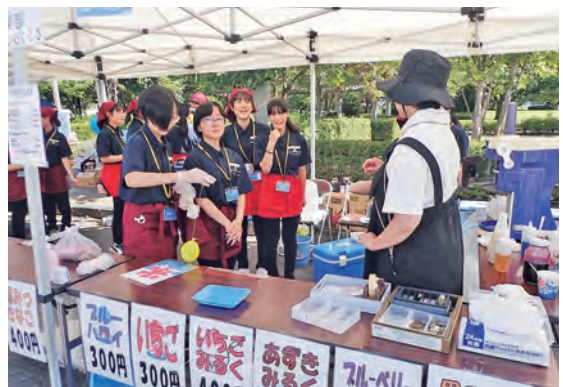
手作りかき氷ノースは絶品！

家庭部は、10/21、22に開催される町産業まつりにも出店します。家庭部で育てたサツマイモなどの販売があります。ぜひお買い求めください。