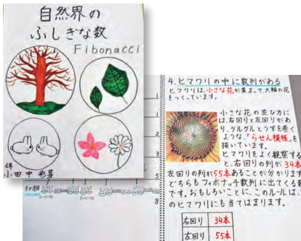
字も図も丁寧でとても見やすい！

中央公民館で開催されていた「夏休み自由研究展」で、「Fibonacci」という見慣れない単語を見かけました。一体なんと読むのか。早速研究を見てみると、なるほど「フィボナッチ数列」のことか！…いや、フィボナッチ数列って何？と気になったので、研究者に会うため御明神小学校へ行ってきました。