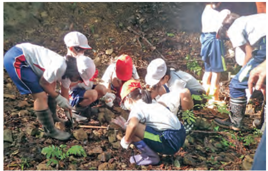
道の駅付近でみんな一緒に化石掘り

両校合同の地域巡りは初の試みでした。お互いの地域のいいところを知るとともに、児童同士の交流を図りました。