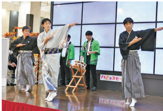
9/9 上長山無形文化財振興会 町指定無形民俗文化財「上長山角力甚句」

町内の民俗芸能団体4団体（9/9は上長山無形文化財振興会と雫石郷土芸能伝承活動細川会、9/10は上町さんさ太鼓伝承会と遊由会（雫高郷土芸能委員会OB・OG）が演舞を披露し、会場を沸かせました。そのほか、町産品の販売コーナーや工作ブースも賑わいを見せました。