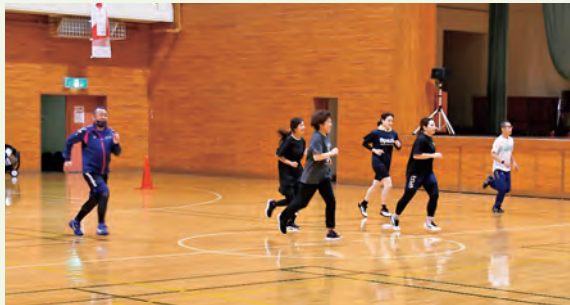
体力測定会で体力年齢をチェック！