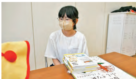
おすすめの本を教えてくださいました

研究のきっかけは「いつも見ている算数のマンガ(「まんがで身につく めざせ! あしたの算数王」ゴムドリ co./文 岩崎書店)に書いてあり、興味を持ったので調べてみました」と教えてくれました。