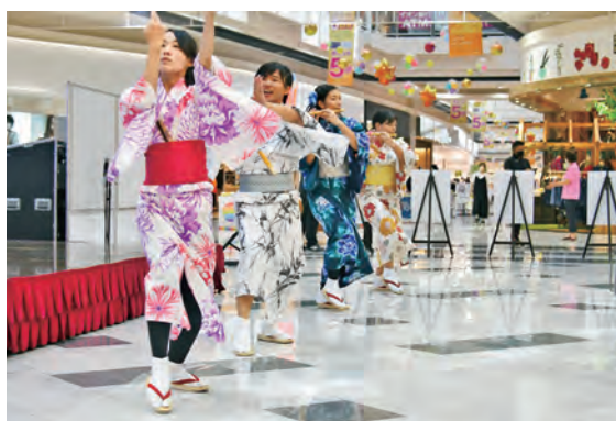
9/10 遊由会 「上駒木野さんさ踊り」