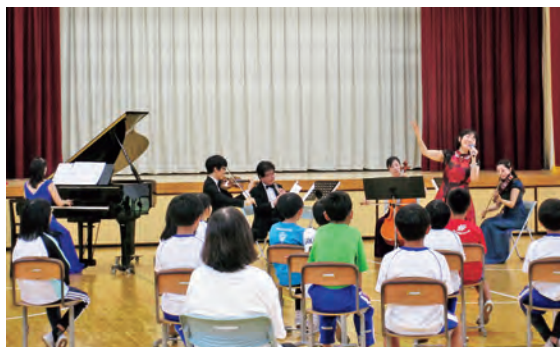
うたのお姉さんの美しい歌声とオーケストラ

この後、11/20 御明神小学校、11/21 西山小学校、12/19 七ツ森小学校で公演が予定されています。