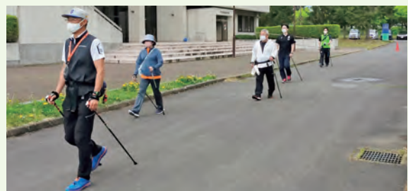
外を歩いて気分リフレッシュ！