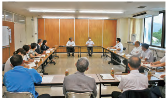
いじめ防止は地域での取組も大事です

今年度もいじめ防止の取組を継続していくため、令和5年度第1回雫石町いじめ防止等対策連絡協議会を開催し、町内小中学校や行政機関などの協議会委員が、いじめ問題の現状などについて情報共有を行い、いじめに対する適切な対応のあり方などについて協議しました。