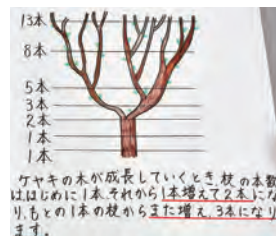
木や花びらにこの現象が現れていることがある