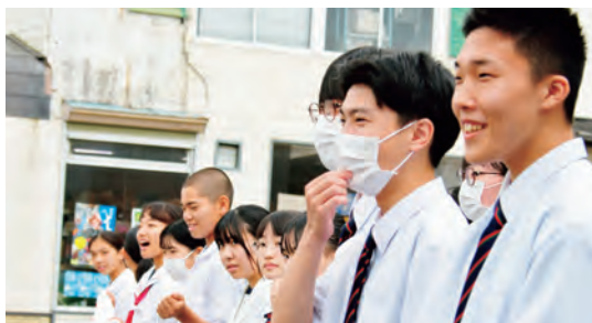
元気な挨拶を皆さんにお届けしました

雫石中と雫石高校の生徒会が合同で挨拶運動を行いました。早朝から、一日目は中学校前に、二日目は雫石歯科前に並び、活動しました。登校する生徒や地域の方に力強く挨拶する生徒たち。共に行動をすることで、お互いの理解を深めました。