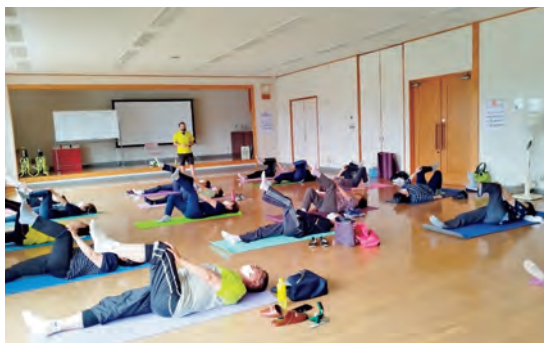
【シニアコース】ストレッチで体をほぐそう

第2クールも誰でも参加できる一般コースをはじめ、シニアコース、男性限定コース、小学生コース、園児コースを用意し、随時受付しています。詳しくは町ホームページをご覧ください。皆さんと楽しく運動しましょう。