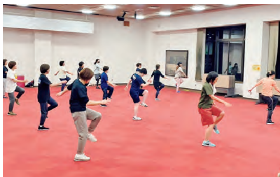
【一般コース】リズムに合わせて体を動かそう