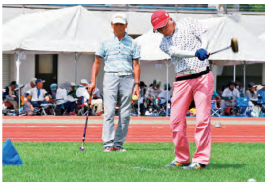
ホールインワンを目指してナイスショット