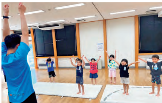
【園児コース】楽しく体を動かそう