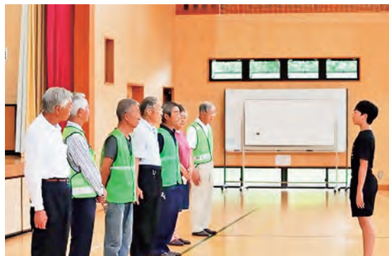
交通ルールを守っていきます

御所小学校では登下校の際、できる人ができる時に行う「ながら見守り」を励行しています。この交流によって児童と地域の距離が近づき、挨拶や会話がしやすくなるのが期待されます。