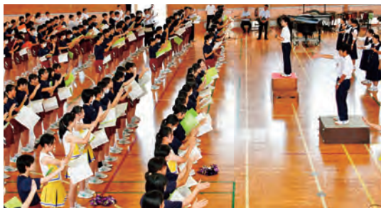
歌い方を一緒に練習

この交流会は、矢巾北中生徒の「雫石中の応援団を見てみたい」という声を受け実現しました。雫石中は、応援団、チアリーダー、吹奏楽部による「雫中魂」のこもった応援を披露。合唱で全国大会にも出場した矢巾北中は「青葉の歌」を披露しました。矢巾北中生から、バターを塗るように手を動かし滑らかに歌う練習方法を教わり、生徒は「『バター唱法』を実践する前と後では、滑らかさが変わって驚いた」と感動。新しい発見があった交流会となりました。