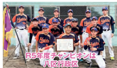
R5年度チャンピオンは 八区行政区

優勝 八区行政区 (西山地区) 第3位 林崎行政区 (西山地区) 準優勝 中島行政区 (御明神地区) 第3位 横欠行政区 (御明神地区)