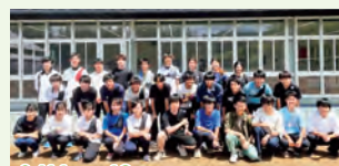
8/11 ~ 13 東北大学アーチェリー部 30人

町では、合宿をする団体に合宿費を補助するほか、鶯宿温泉宿泊で施設利用料半額とするなど、積極的に合宿を誘致しています。より多くの競技者が雫石を訪れ、地域が賑やかになることを目指しています。競技者を見かけたら、是非温かい声援をお願いします。みなさん一緒にアーチェリーセンターを盛り上げましょう!