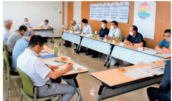
現実的な解決策はとても難しい

現地での点検を終えた後、すべての要望箇所について協議を行いました。協議では、委員の皆さんがそれぞれの見地から「横断歩道は自動車の行動を制限する側面もあることから、新たに設置するには交通量や横断歩道の使用頻度などを十分に検討しなければならない」「歩道の拡幅には多大な予算と長期の期間が必要。舗装や補修に合わせて区画線の引き直しやグリーンベルトの設置などを行っていくほうが現実的ではないか」といったさまざまな意見が出され、子どもも含めた地域の安全について活発な話し合いがされていました。