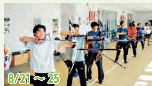
8/21 ~ 25 筑波大学アーチェリー部 16人