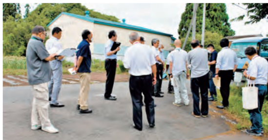
現場を見ると違いますね

御明神小学校と雫石中学校から横断歩道の設置要望のあった、御明神地区の上春木場踏切北側 T 字路（和野行政区）では「カーブに横断歩道を設置するのはむしろ危険。見通しのよい他のところで横断させるなどの安全誘導をしてほしい」との意見が出されていました。