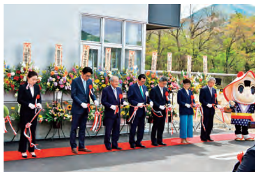
グランドオープン テープカット

4月30日はアーチェリー体験会を開催しました。多くの参加者が来場し、新しい施設でのアーチェリー体験を楽しみました。