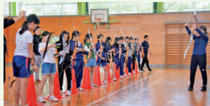
5/31 西山小クラブ体験会の様子