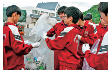
約10 kmの道のりをみんなでゴミ拾い

この活動は、昭和53年、5月30日の「ごみゼロ」の日に合わせて、「町内環境整備」として国道46号の清掃活動を行ったのが始まりです。以降、毎年5月末に清掃活動を実施し、今年で46回目となります。