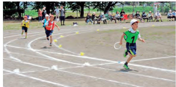
5/27 御明神小学校 運動会 (低学年リレー～みんなでつなごう1つの輪)