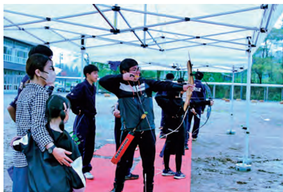
お父さんもアーチェリー体験