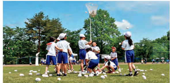
5/20 御所小学校 運動会 (紅白チェッコリー玉入れ)