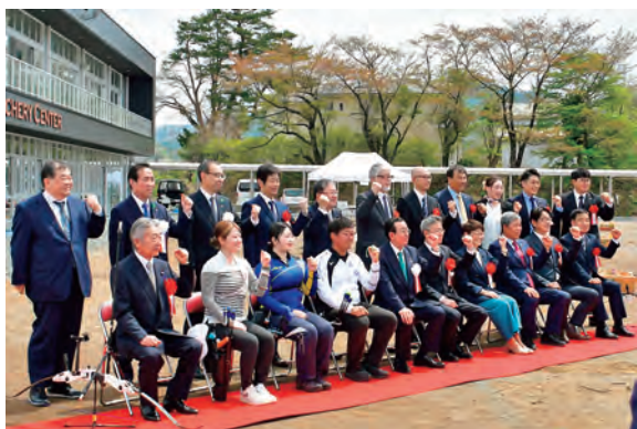
来賓、関係者のみなさん