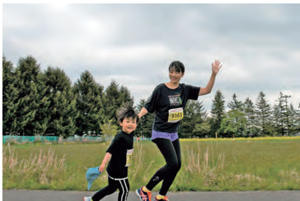
ファミリーペアでがんばります