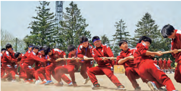
5/18 雫石中学校 体育祭 (男女混合綱引き)

5/18に雫石中学校で体育祭が、5/20と5/27に各小学校で運動会が開催されました。