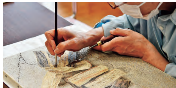
点描という描き方

わけではなく、各々が自由に作品作りに取り組んだり、日頃の情報を交換しながら、楽しく活動をしています。