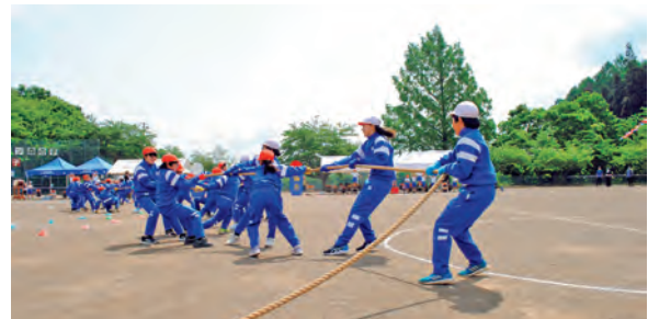
5/27 七ツ森小学校 運動会 (いつ引くの？今でしょ!!)