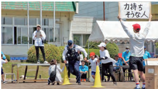
5/27 西山小学校 運動会 (どこにいるの？お助けマン！)