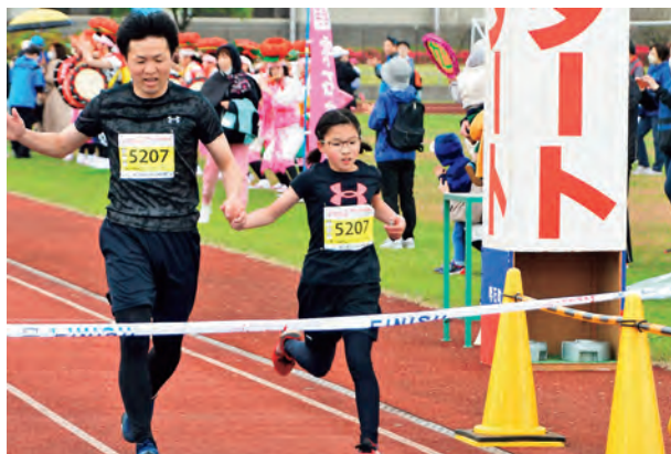
手をつないでフィニッシュ