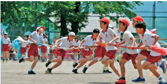
5/27 雫石小学校 運動会 (Eye of the Storm)