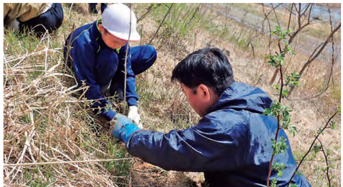
チョウセンアカシジミが来てくれるといいな

この日植えたデワノトネリコが成長するには数年かかります。すぐに結果が分かることではないだけに、想いを共有し、次の世代に繋いでいくことが大切な取組です。