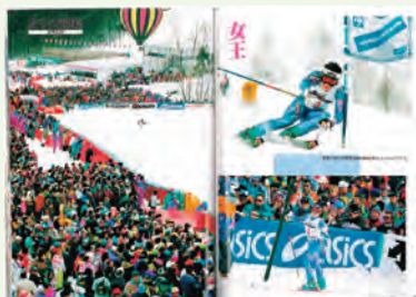
1993年世界選手権が 雫石で開催されました