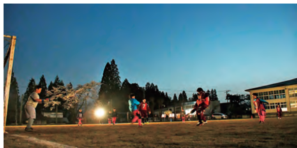
先輩のシュートをキャプテンがブロック

日頃の練習も楽しみながら真剣に取り組んでいる団員。この日は中学生の先輩も交えての練習も。辺りが暗くなってもボールを追いかけます。