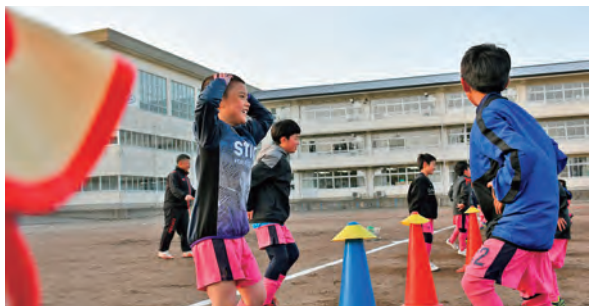
笑顔でフットワーク練習

今回しずくちゃんが潜入したのは「雫石町サッカースポーツ少年団」。雫石小と御所小、西山小の2～5年生が活動しています。町内唯一のサッカー少年団の練習にお邪魔してきました。