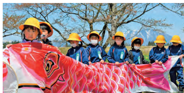
掲揚を手伝ってくれた西山小1年生

第29回雫石川に鯉のぼりを泳がせよう掲揚式が開催され、西山小学校の1年生21人が参加しました。天候にも恵まれ、約100匹の鯉のぼりが児童の手によって雫石川上空に掲揚されました。