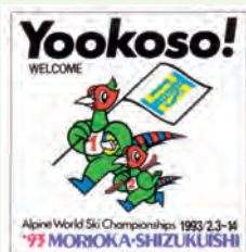
'93世界大会マスコット キャラクター 「ケンタ」「ミミ」