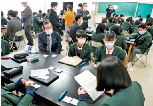
2/13に開催された虹色コンパス報告会

令和4年度に開催された報告会では、一年間の取組について課題や成果を発表し、生徒はより学びを深めました。今後も、地域で活躍する人材や地域の人たちとの交流の中で学びを深める虹色コンパスの活動は続いていきます。