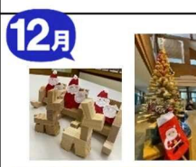
クリスマスサロン