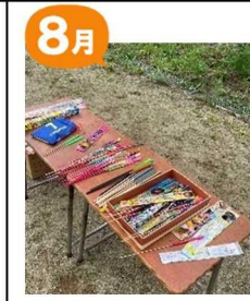
手持ち花火 しょうの会