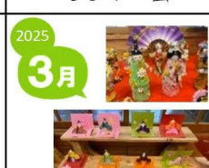
ひなまつりサロン