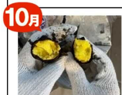
やきいも ハロウィンサロン